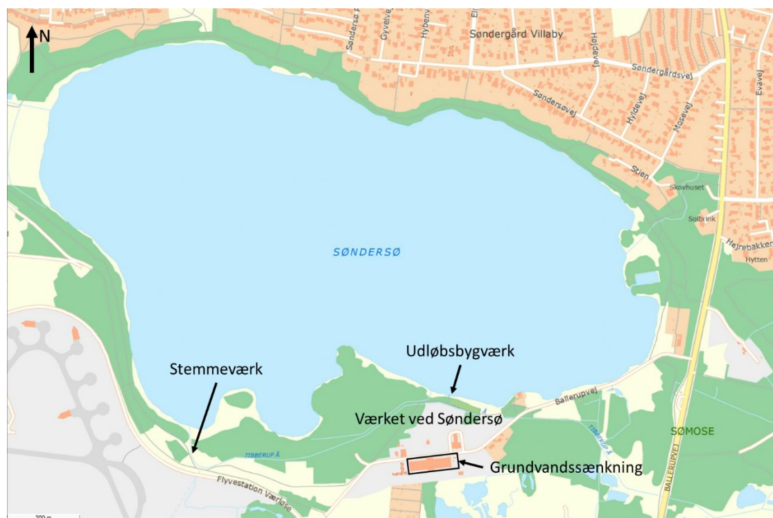
Figur 2. Oversigtskort.

Placeringen af aktiviteterne fremgår af figur 2.