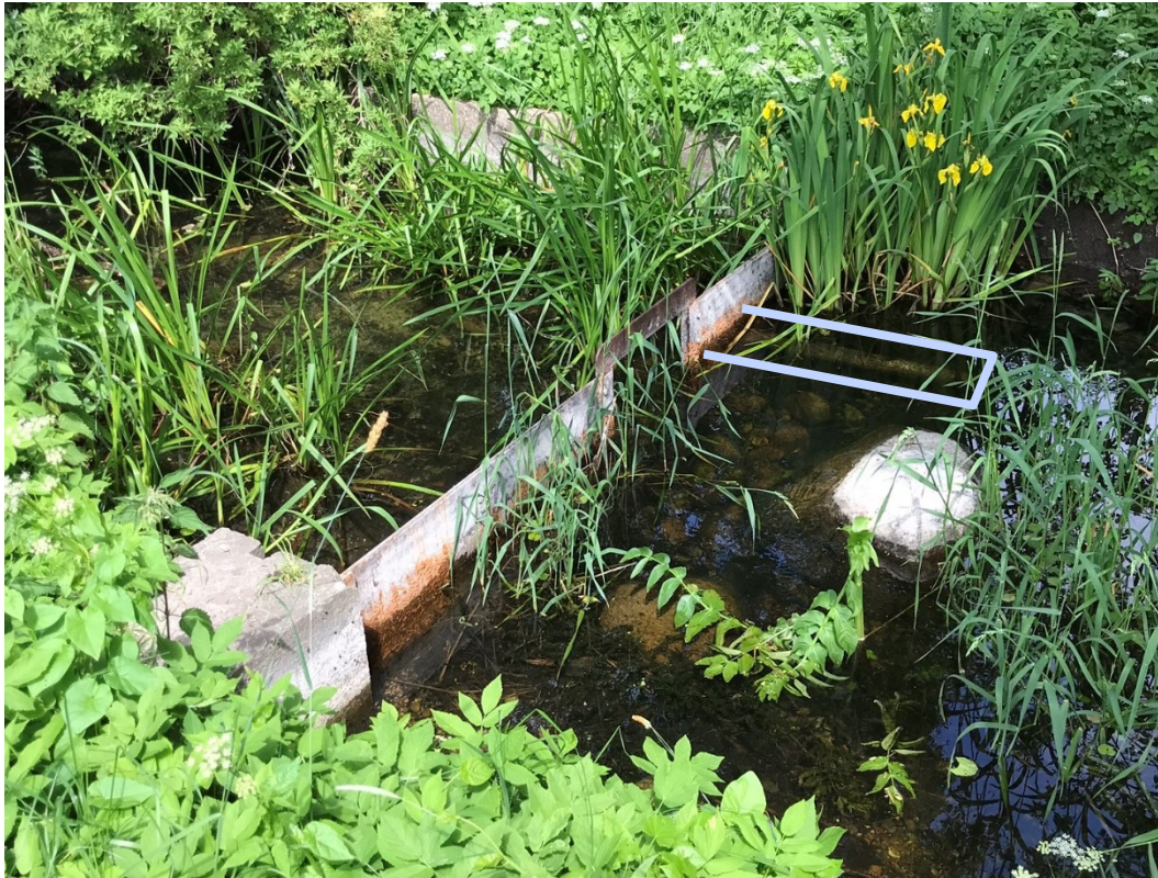
Figur 5. Det eksisterende stemmeværk i kanalen, som forbinder Søndersø og Tibberup Å, juni 2020. De grå streger markerer placeringen af en rørgennemføring i den østlige side af stemmeværket.

I forbindelse med udledningen af procesvand i Etape I i det anmeldte projekt modificeres stemmeværket således, at det i højere grad kan kontrolleres, hvor meget vand der strømmer fra Søndersø til Tibberup Å.