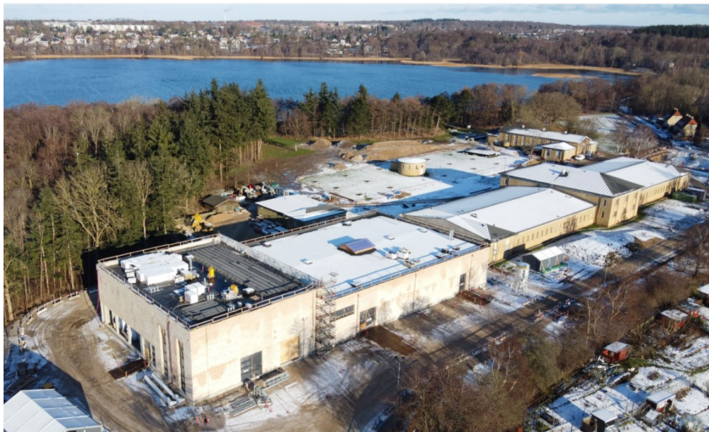
Figur 1. Værket ved Søndersø, februar 2021. I forgrunden værket, med Søndersø og Værløse i baggrunden. I den vestlige ende (nærmest) er bygningen til overfladevandsanlægget nedrevet, og en ny bygning, indeholdende filtre, iltningsanlæg og blødgøringsanlæg, er opført. Den østlige del af bygningen indeholder de oprindelige sandfiltre m.m. og er fortsat i brug, indtil den i Etape II delvist nedrives og indbygges med tankanlæg.

myndigheder og andre interessenter, der kan blive berørt af projektet, mulighed for at stille spørgsmål og komme med input til miljøkonsekvensrapportens indhold. I forbindelse hermed har der været afholdt borgermøde den 7. november 2019 på Værket ved Søndersø. Ved 1. offentlighedsfase kom der i alt 6 høringsvar.