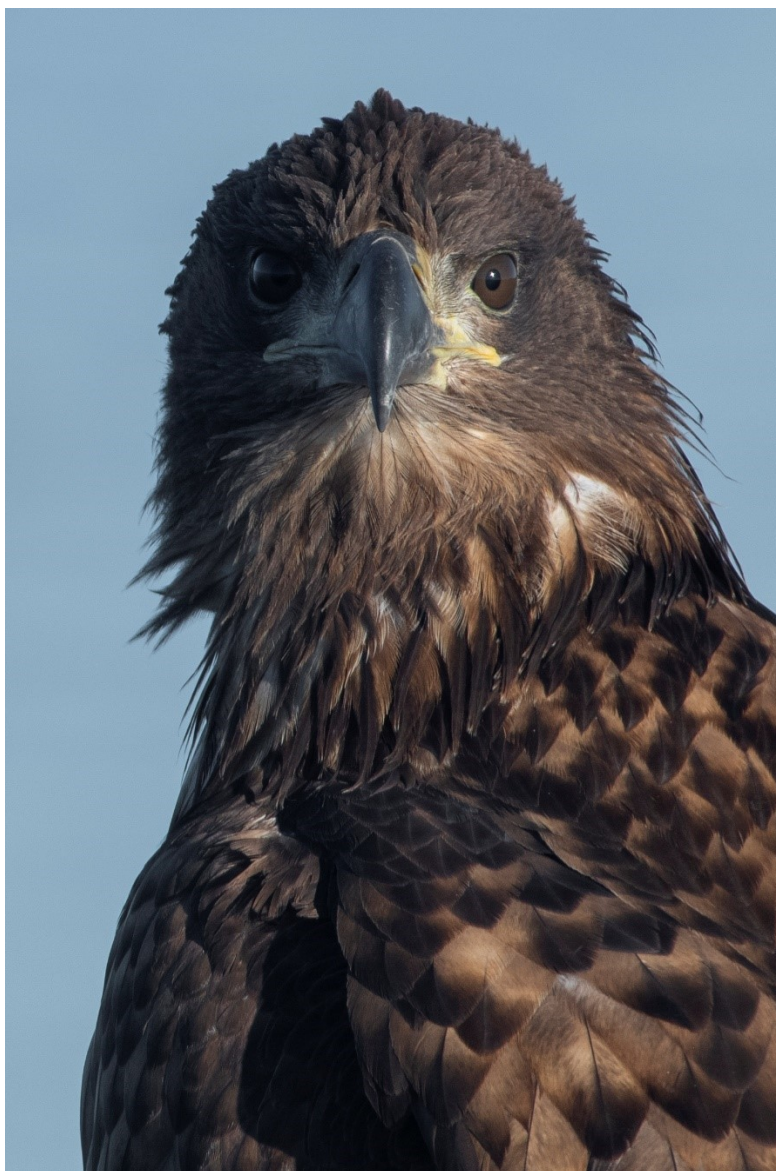
Figur 2.2: Havørn er i fremgang i Danmark, og yngler bl.a. her i Natura 2000-området.

For samtlige Natura 2000-planer er der foretaget en strategisk miljøvurdering (SMV). Natura 2000-planerne og de tilhørende miljøvurderinger kan findes på Miljøstyrelsens hjemmeside under Natura 2000, tredje generation planer (2022-2027).