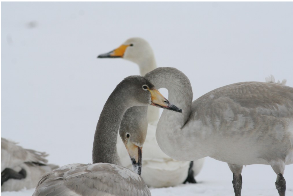
Figur 3.1: Sangsvaner er trækfugle på udpegningsgrundlaget for Natura 2000-området.

Effekten af indsatserne bliver løbende vurderet i det Nationale Overvågningsprogram for Vandmiljø og Natur (NOVANA), som overvåger vandmiljøets og naturens tilstand inden for de områder, der prioriteres i forhold til de politisk fastsatte økonomiske rammer.