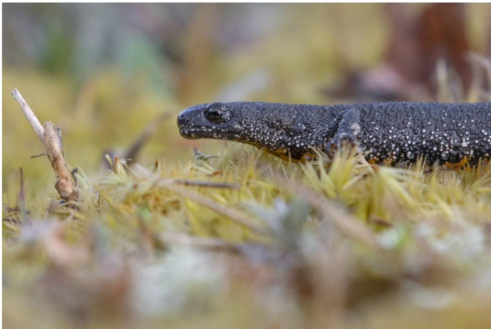
Figur 6.1: Stor vandsalamander yngler i flere vandhuller i Natura 2000-området.

Miljøstyrelsen vil fortsat prioritere at indgå i relevante Life-projekter nye som gamle.