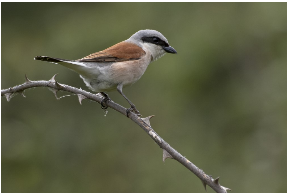
Figur 4.1: Natura 2000-området er særligt udpeget som ynglested for rødrygget tornskade.

På skovbevoksede arealer vil mange af de tiltag, der implementeres for skovnaturtyperne også være gavnlige for de arter, der er knyttet til naturtyperne. I nedenstående gennemgås eksempler på indsatser, der også gavner arter og fugle, hvor indsatserne i forvejen gennemføres i området jf. Natura 2000-planen. Urørt skov samt skovnaturtypebevarende drift og pleje med bevaring af træer til naturligt henfald kan bidrage til at forbedre levesteder for områdets skovtilknyttede arter og fugle. Nogle arter og fugle er afhængige af hensigtsmæssig hydrologi, lysninger eller ro i yngleperioden.