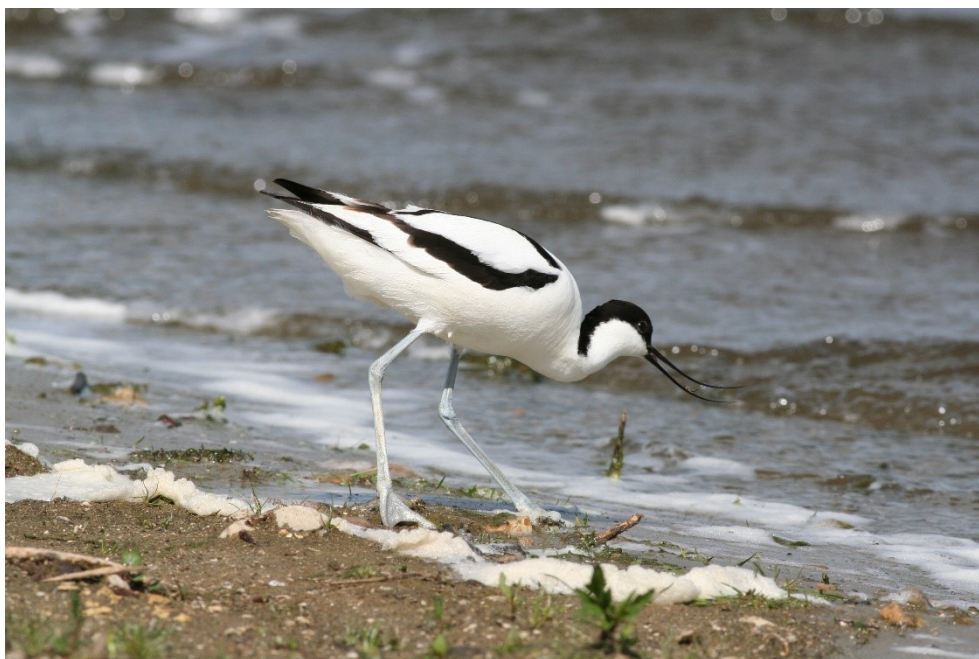
Figur 2.1: Klyden er som én af de ynglende vadefugle i Natura 2000-området, en del af udpegningsgrundlaget.

Offentlige lodsejere, som ejer arealer i Natura 2000-området, kan vælge at gennemføre Natura 2000-planen direkte i egne planer for forvaltningsindsatser (eks. drifts- og plejeplaner). Der udarbejdes ikke handleplan for de offentlige lodsejeres arealer, hvor de selv udarbejder planer for forvaltningsindsatser, hvorfor data fra deres arealer ikke indgår i selve handleplanen, men kun fremgår af bilag 1. Naturstyrelsen ønsker selv at udarbejde plan for forvaltningsindsatsen på egne arealer, og resuméer af disse planer kan ses i bilag 1. Hvis der er behov for at tydeliggøre ansvarsfordelingen mellem aktører (heriblandt offentlige lodsejere med egne planer for forvaltningsindsatser), tydeliggøres dette i kapitel 5.