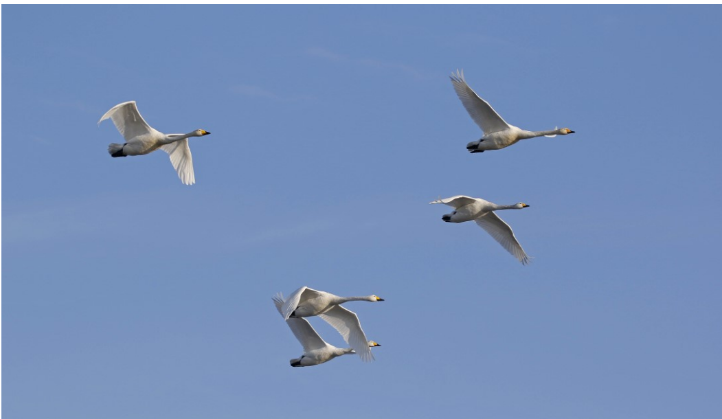
Sangsvaner bruger området til rast og fouragering.

Vurdering af betydningen af forstyrrelser af arter bygger i udgangspunktet på de vurderinger, som DCE Aarhus Universitet udarbejdede, da forstyrrelser og behov for justeringer af vildtreservaternes geografiske afgrænsning og adgangsforhold blev vurderet i 2013.