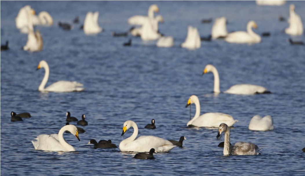
Sangsvaner bruger fjorden til rast og fouragering.