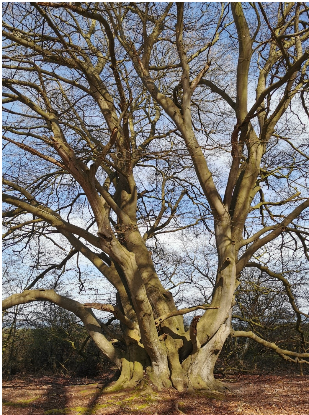
Langs kysten af Kajbjerg Skov findes stedvis nogle gamle og skulpturelle bøg og eg, som er levested for mange forskellige organismer.