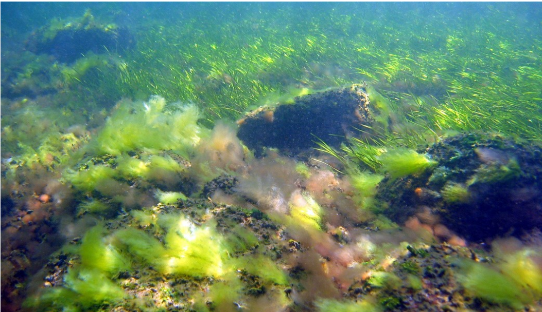
Stenrev med vegetation og ålegræs i baggrunden.

Kirkegrund er placeret i vestlige del af Smålandsfarvandet på vanddybder mellem 5 og 20 m. Området består af en generelt øst-vest orienteret moræneryg med en bredde på 1-2 km. I den centrale del af området er der meget lavvandet med kun lidt mere end 2 meters vanddybde, hvor der ses sten i varierende størrelse og tæthed. De mange sten i området danner grundlag for et rigt og varieret dyreliv og undervandsvegetation, hvor især store rødalger og blåmuslinger er dominerende. Området er et vigtigt fødesøgningsområde for fisk og andre marine dyr.