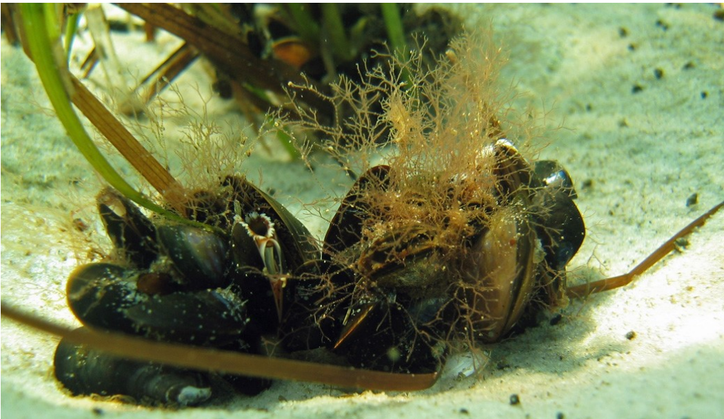
Muslinger på sandbund i området med ålegræs i baggrunden.

Udvalgte forvaltningsbare parametre i tilstandssystemet gennemgås i basisanalyserne, og det kan heraf ses hvilke tiltag, der kan iværksættes for at sikre eller genoprette naturtyperne eller arterne/fuglenes levesteder.