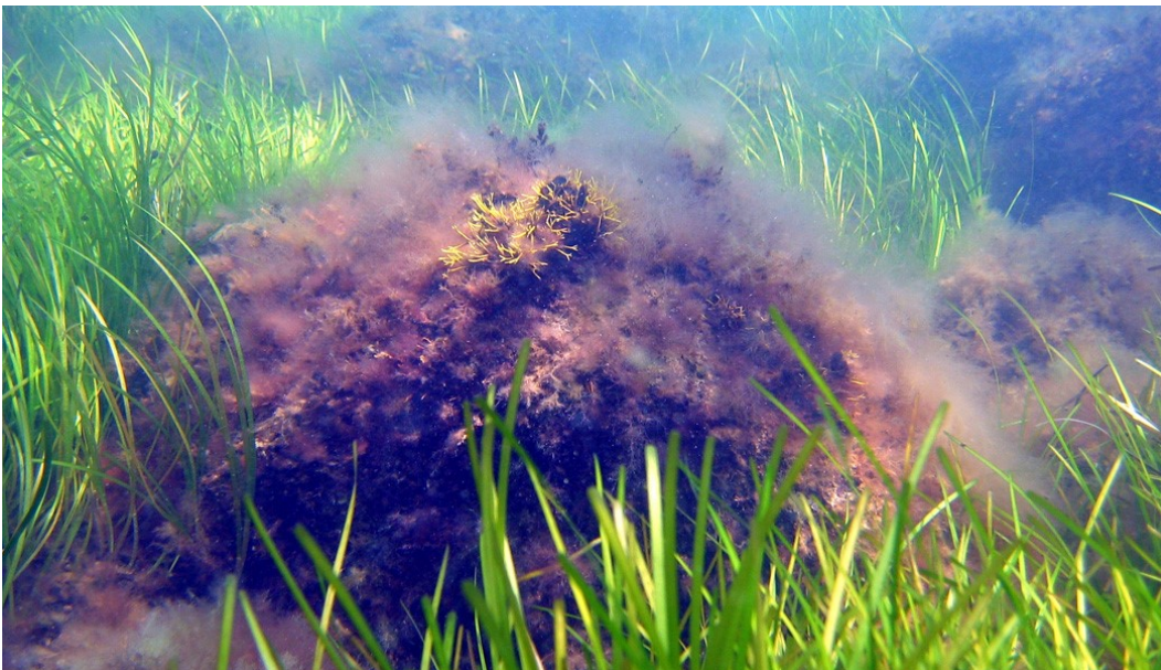
Stenrevet ved Kirkegrund udgør levested for en lang række marine alger og dyr i Natura 2000-området.

Vandområdeplanernes indsatser bidrager både med foranstaltninger til at undgå yderligere forringelser og med foranstaltninger til genopretning af bevaringsstatus. Indsatserne kan eksempelvis være reduktion af kvælstof- og fosforbelastningen til søer, reduktion af tilledningen af organisk stof til vandløb samt reduktion af kvælstofbelastningen til marine vandområder. Hertil kommer fx genslyngning af vandløb og fjernelse af spærringer. De konkrete indsatser for planperioden 2022-2027 er beskrevet i de nye vandområdeplaner og fremgår af indsatsbekendtgørelsen. Indsatserne vil også blive præsenteret i MiljøGIS for vandområdeplanerne på Miljøstyrelsens hjemmeside .