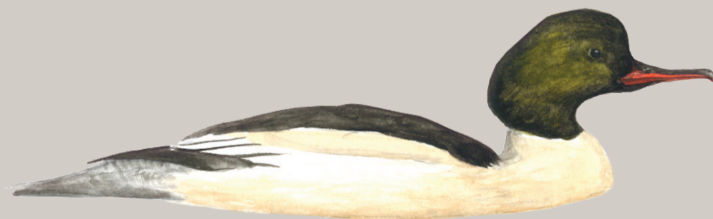
Stor skallesluger. Illustration: Jens Overgaard Christensen

Læs mere om Ramsar, Natura 2000 og vildtreservater på www.naturstyrelsen.dk