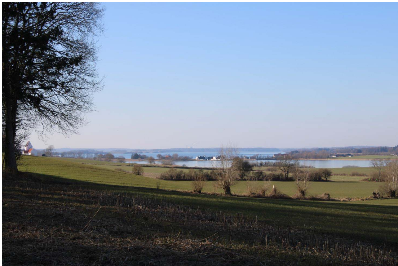
Kig ud over Føns Vang og Gamborg Fjord

Projekterne gennemføres ved frivillige aftaler, og derfor er det i mange tilfælde ikke på nuværende tidspunkt muligt at beskrive hvornår projekterne fysik bliver udført. Kommunerne og Miljøstyrelsen vil i hvert enkelt tilfælde sørge for, at relevante interessenter bliver inddraget.