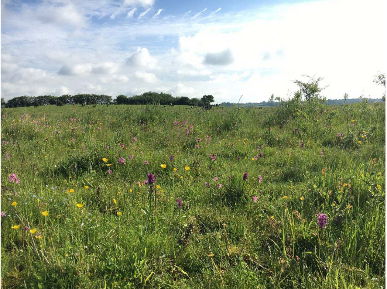
Rigkær i Hejls Nor nær Aller Å (Dorthe Aaboer)