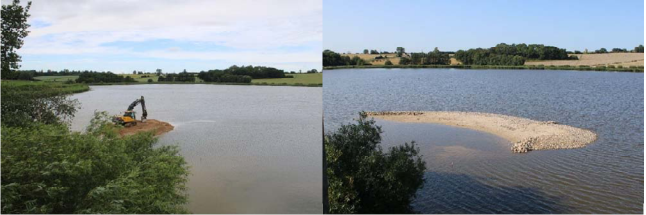
Etablering af fuglø i Føns Vang i forbindelse med Better BirdLIFE-projektet 2020 (Jakob Pedersen).