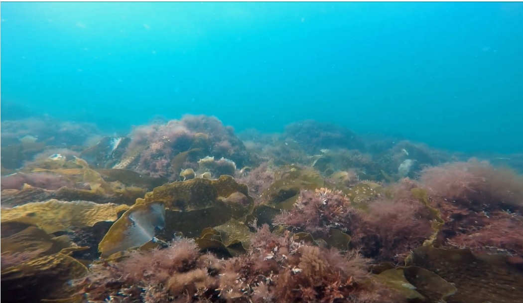
Naturtypen stenrev der findes i området.