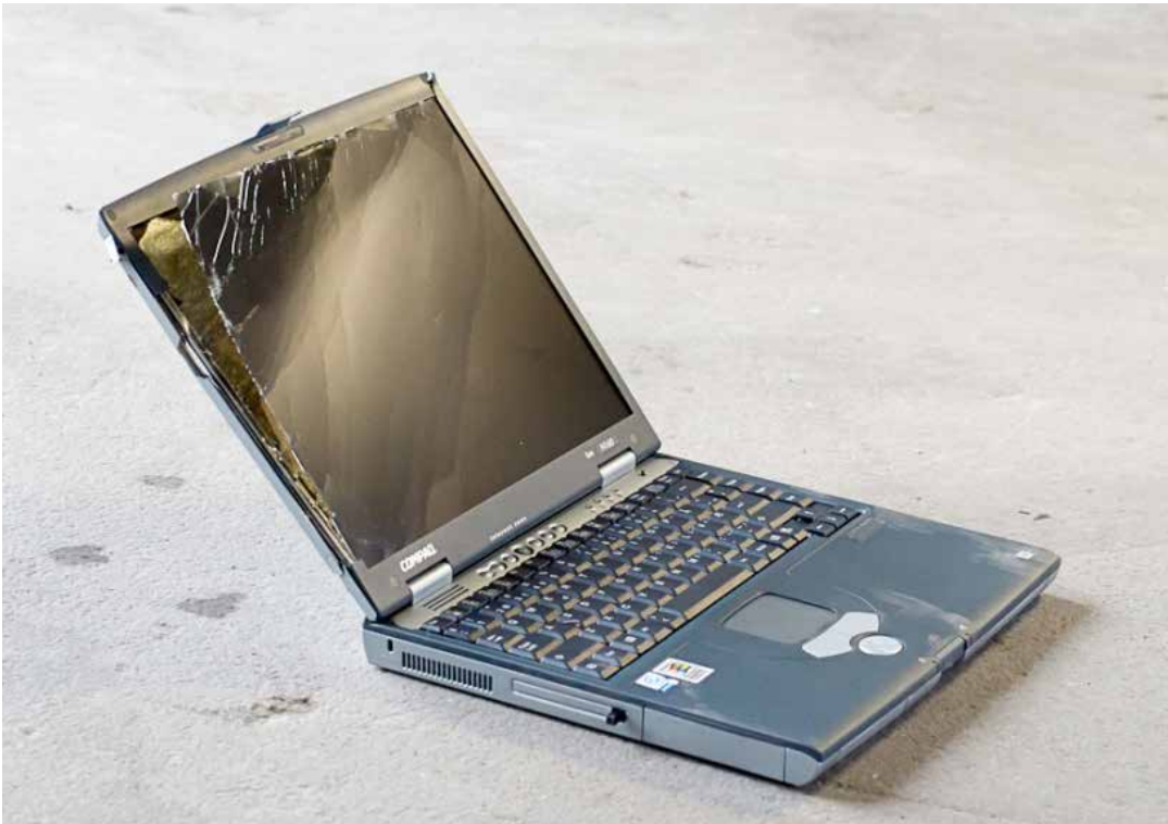
Eksempel på bærbar computer med væsentlige skader, og som derfor må konstateres ikke at være funktionsduelig.