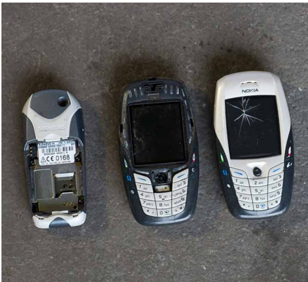
Eksempler på mobiltelefoner med væsentlige skader og slid og som derfor må konstateres ikke at være funktionsduelige.

Der kan anvendes forskelligt software til at afprøve funktionsdueligheden af indre komponenter. Det anbefales at anvende godkendte og/eller certificerede værktøjer til at sikre datasletning.