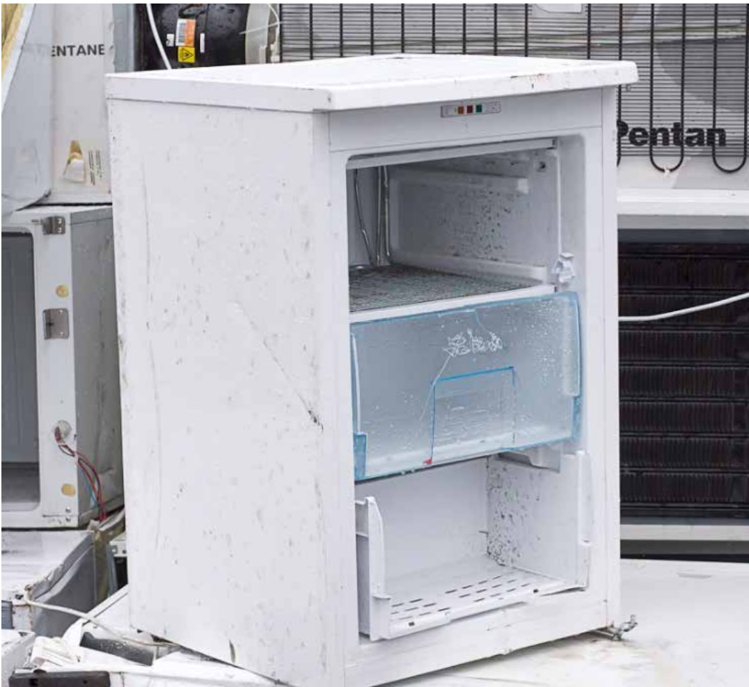
Eksempel på et køleskab, som mangler dør/låge og derfor må konstateres ikke at være funktionsdueligt

Denne retningslinje beskriver, hvordan du afprøver funktionsdueligheden af køleskabe, frysere og kombinerede køleskab/fryser og hvilke farlige stoffer, du særligt skal være opmærksom på i forbindelse med denne produkttype.