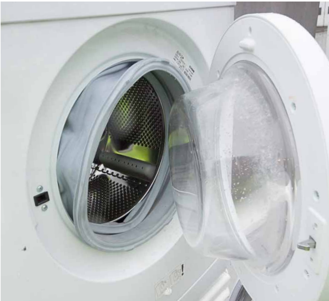
Eksempel på vaskemaskine med tætningsliste, som udviser alvorligt tegn på skade og slitage, og derfor må konstateres ikke at være funktionsduelig.

Denne retningslinje beskriver, hvordan du afprøver funktionsdueligheden af vaskemaskiner og hvilke farlige stoffer, du særligt skal være opmærksom på i forbindelse med denne produkttype. Retningslinjen kan også anvendes på tørretumblere og opvaskemaskiner , dog med nogle justeringer f.eks. hvilke program-cykluser, der bør afprøves.