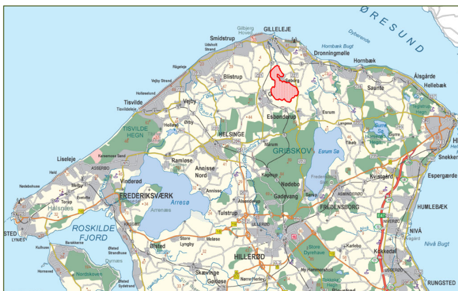
Figur 1: Projektområdet ved Søborg Sø markeret med rødt nord for Gribskov

I november 2016 blev naturgenopretningsprojektet Søborg Sø vedtaget i regeringsgrundlaget ”For et friere, rigere og mere trygt Danmark”, som en del af det Grønnere Danmarkskort. Søborg Sø var før tørlægningen i 1870’erne Nordsjællands fjerde største sø. Ønsket om at genetablere søen bunder i en forventning om, at det vil have flere positive effekter for såvel natur, miljø og klima samtidig med, at der skabes yderligere rekreative værdier i området og de kulturhistoriske værdier bevares.