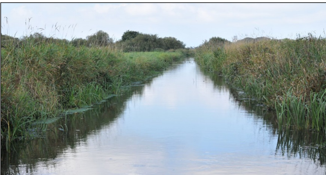
Nedre del af Kimmelkær Landkanal efter en regnvejrperiode.

Indsats til bedring af vandkvaliteten i overflade- og grundvand gennemføres som led i vandplanlægningen, ligesom reduktion af kvælstofdeposition sker gennem husdyrgodkendelsesloven og generelle tiltag til at mindske luftforureningen, og er således ikke en del af Natura 2000-planens indsatsprogram.