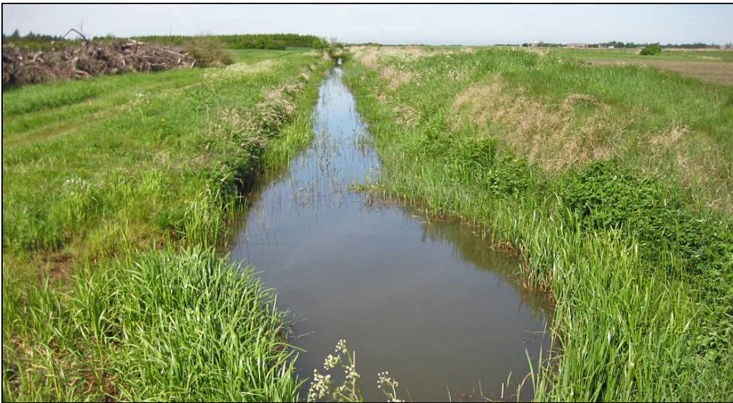
Kimmelkær Landkanal.

Dette Natura 2000-område er specielt udpeget på grundlag af en væsentlig tilstedeværelse af vandranke . Natura 2000-planens målsætninger og indsatsprogram er væsentlige elementer i beskyttelsen af arten og af en generel sikring og forbedring af områdets naturværdier.