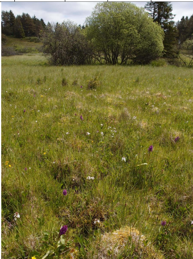
Rigkærsparti i Ansø Enge med blandt andet maj-gøgeurt, bukkeblad og engkabeleje.