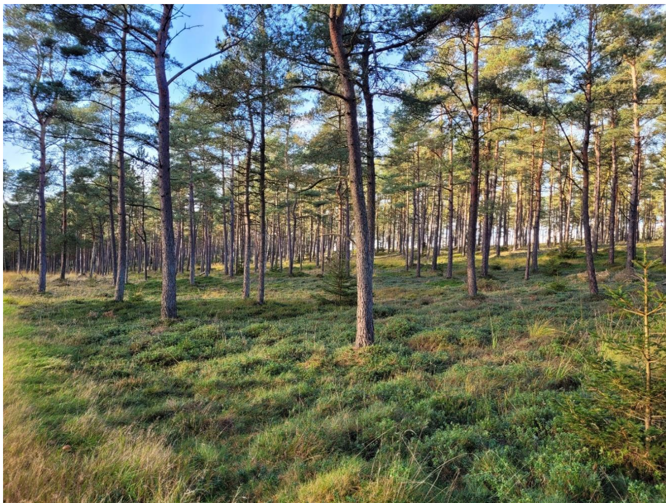
Lysåben fyrskov med hede vegetation i bunden i Gludsted plantage ved Kolpendal.

Indsatsen udføres både på offentlige og private arealer i området. Projekter på private lodsejeres arealer gennemføres i videst muligt omfang gennem frivillige aftaler. Der findes blandt andet en række understøttende tilskudsordninger, som kan søges gennem Landbrugsstyrelsen og Miljøstyrelsen, samt midler til Life-projekter som medfinansieres af EU.