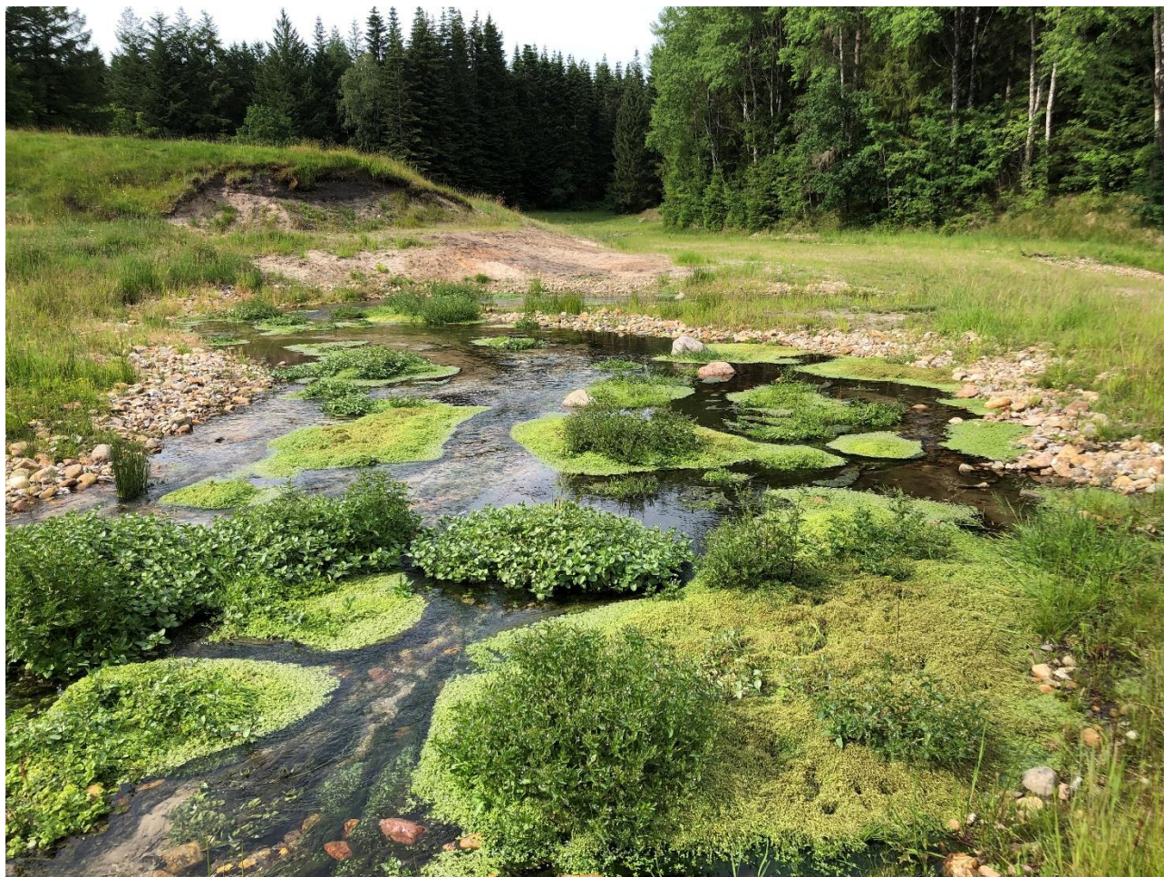
Del af ny vandløbsstrækning efter naturgenopretning ved Sillerup Væld.

Effekten af indsatserne bliver løbende vurderet i det Nationale Overvågningsprogram for Vandmiljø og Natur (NOVANA), som overvåger vandmiljøets og naturens tilstand inden for de områder, der prioriteres i forhold til de politisk fastsatte økonomiske rammer.