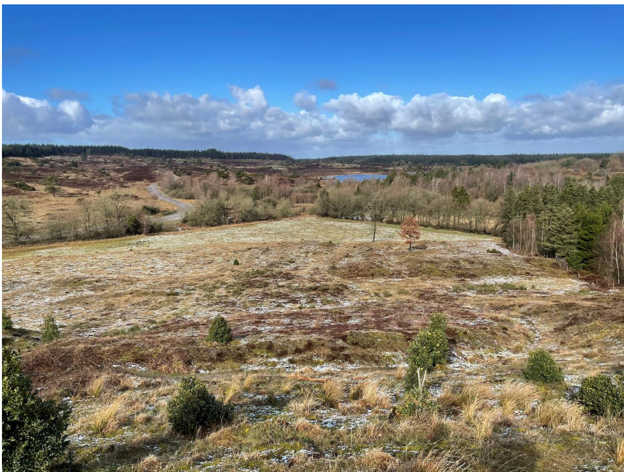
Udsigt over ny natur og Vrads Sande i baggrunden