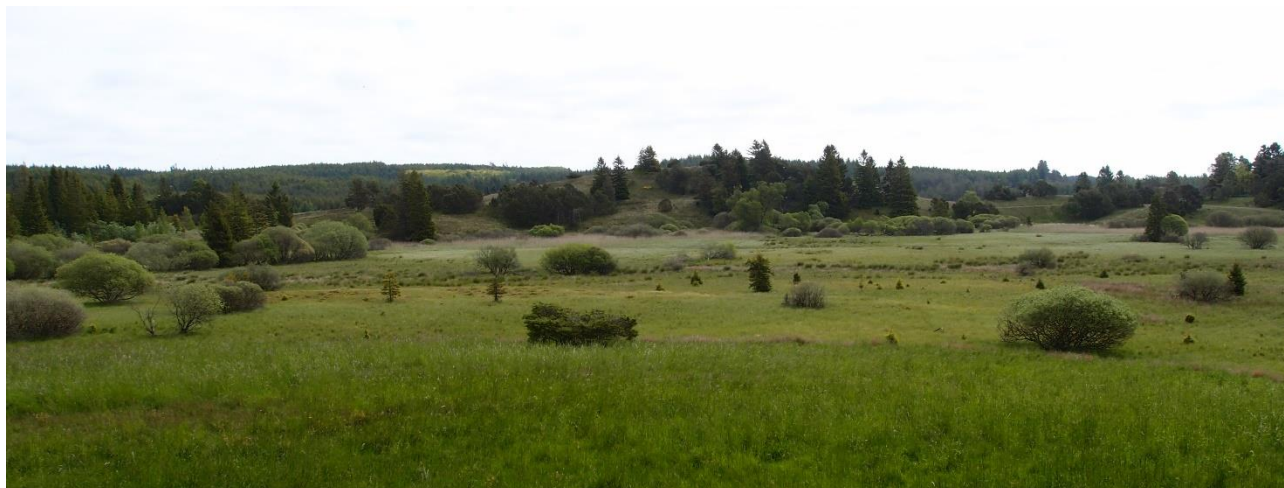
Ansø enge med Blæsbjerg i baggrunden.

Der er noteret odder nær Boest Bæk og Mattrup Å ved kommunegrænsen mellem Ikast-Brande og Horsens Kommune. De vandløbstilknyttede arter på udpegningsgrundlaget håndteres i vandplanen.