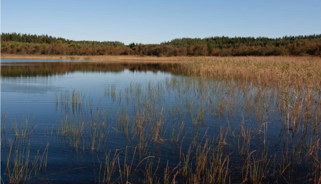
Udsigt over Skørsø som er naturtypebestemt som lobeliesø.

Natura 2000-området Skørsø har et samlet areal på 12 hektar, hvor af de 8 hektar er sø. Området er afgrænset som vist på kortet. Området er udpeget som Habitatområde nr. 53 Skørsø og området ligger i Holstebro og Skive Kommune inden for vandområdedistrikt Jylland og Fyn. Området er privatejet.