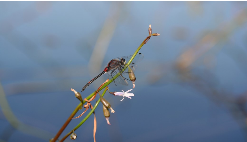
Skørsø er naturtypebestemt som lobeliesø, hvor tvepibet lobelie er en karakteristisk art for naturtypen.

Udvalgte forvaltningsbare parametre i tilstandssystemet gennemgås i basisanalyserne, og det kan heraf ses hvilke tiltag, der kan iværksættes for at sikre eller genoprette naturtyperne eller arterne/fuglenes levesteder.