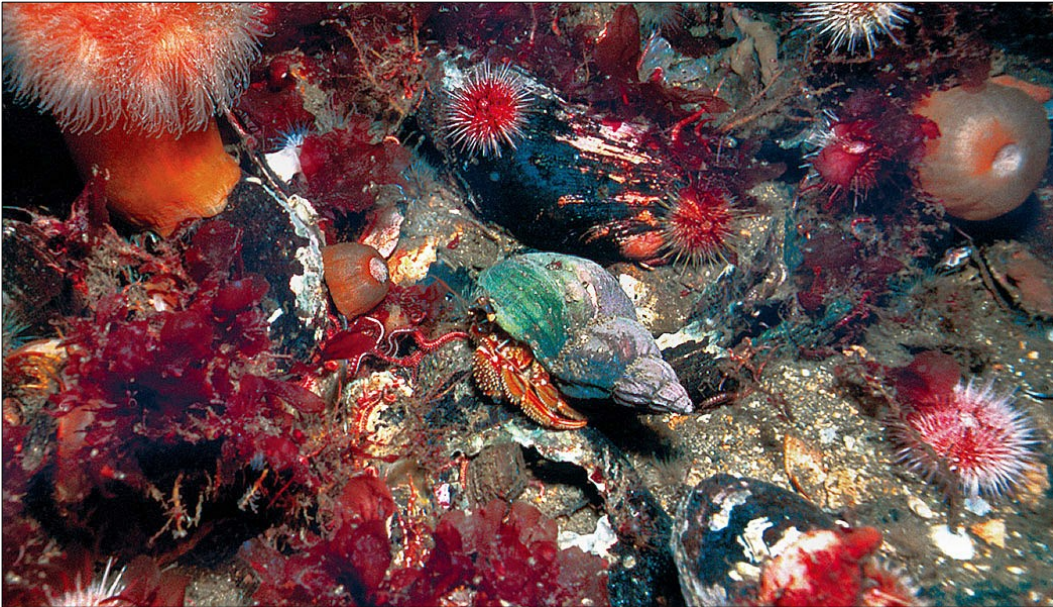
Stenrev med et bredt udsnit af det mangfoldige dyreliv der oftest ses på denne naturtype.