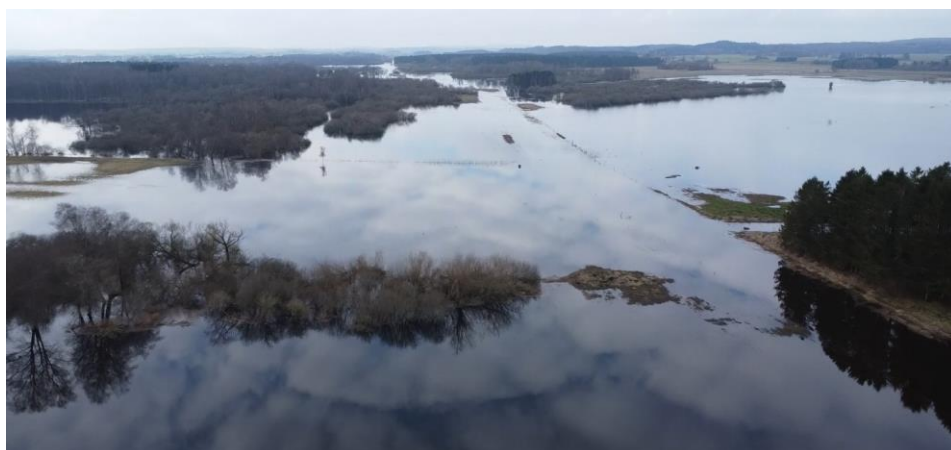
Dronefoto af Kongemosen i Store Åmose fra februar 2024