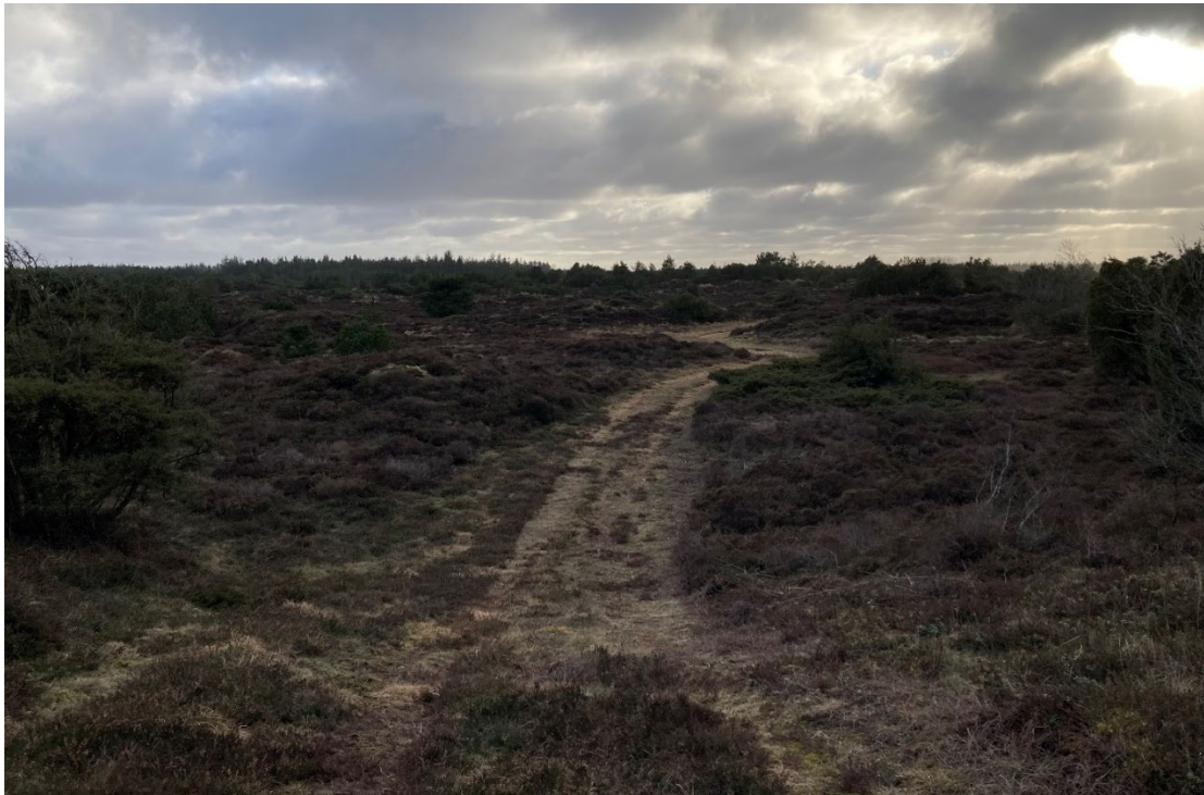
1 Den nordøstlige del, blik mod sydvest

Billederne er taget den 17. februar 2024. Det er tydeligt, at heden mangler pleje i form af fjernelse af træer og foryngelse af lyngen.