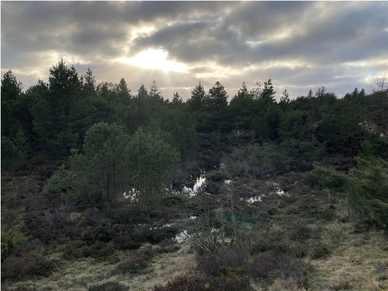
Rejkær Sande, den nordøstlige del. Blik mod sydvest