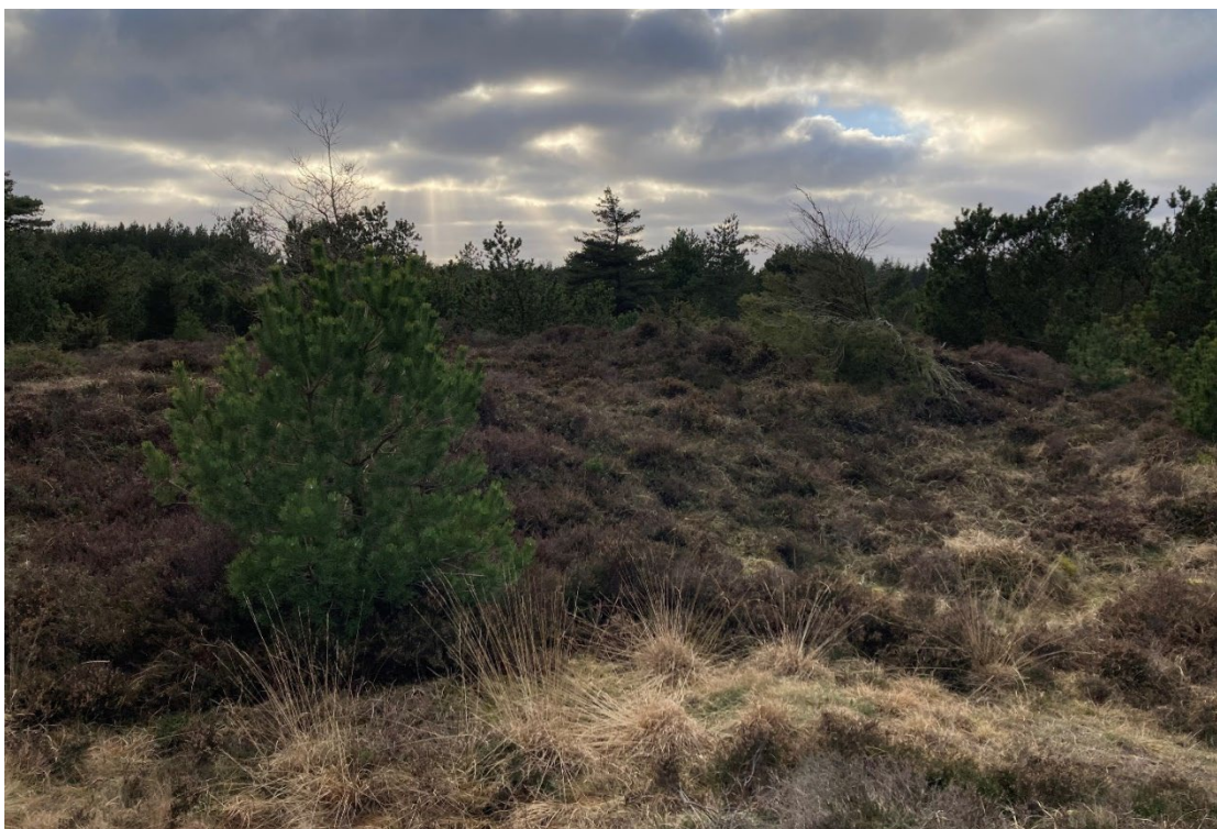
2 Den nordlige del, blik mod sydvest