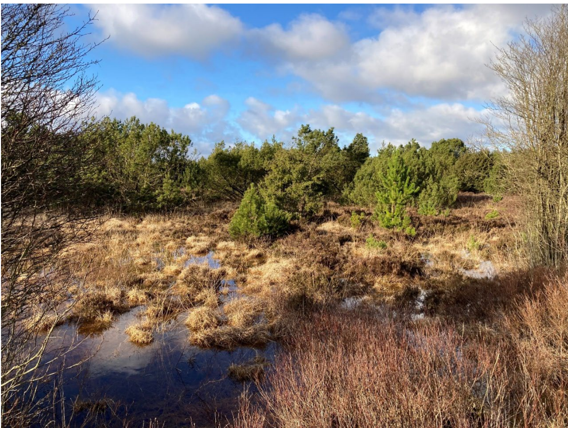
4 Det sydlige hjørne, blik mod nordvest