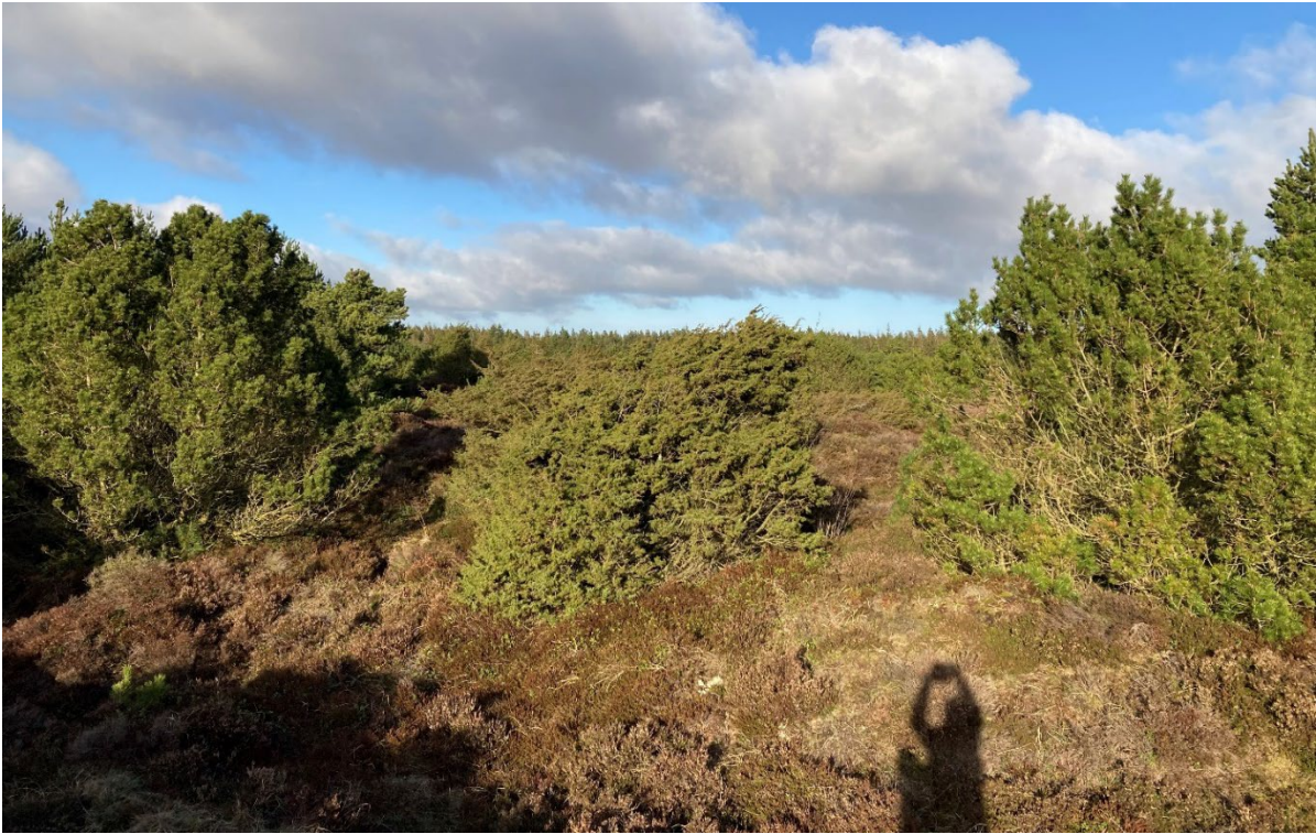
5 Den østlige del, klittop ved P-plads. Blik mod nordvest