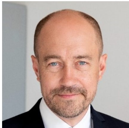
Miljøminister Magnus Heunicke

Natura 2000-områder rummer nogle af Europas og Danmarks største og mest værdifulde naturområder og repræsenterer en stor del af biodiversiteten. De danske Natura 2000-områder bidrager til det fælles EU-mål om 30 pct. beskyttet natur på land og til havs.