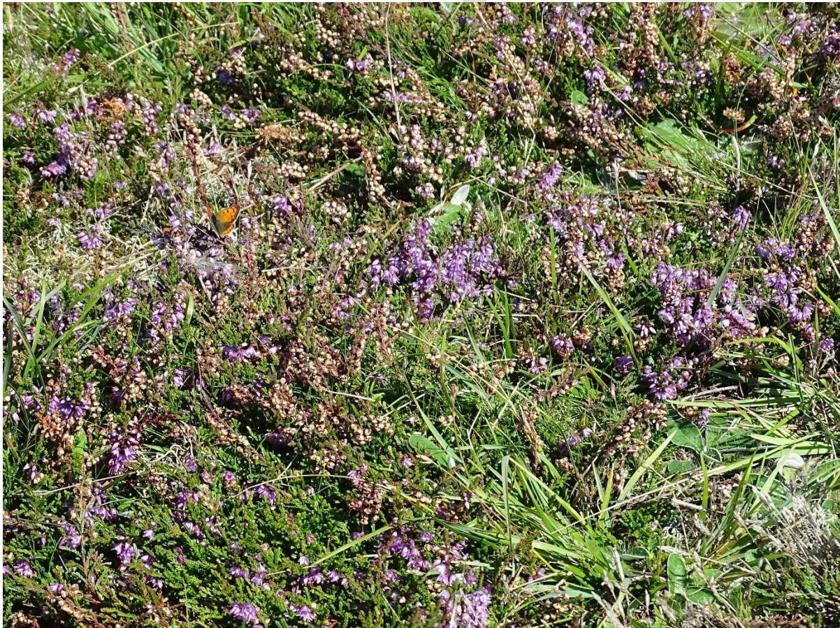
Skrænt ved Langemose med håret høgeurt ( Pilosella officinarum ), hedelyng ( Calluna vulgaris ), og fødesøgende lille ildfugl ( Lycaena phlaeas )

For samtlige Natura 2000-planer er der foretaget en strategisk miljøvurdering (SMV). Natura 2000-planerne og de tilhørende miljøvurderinger kan findes på Miljøstyrelsens hjemmeside under Natura 2000, tredje generation planer (2022-2027).