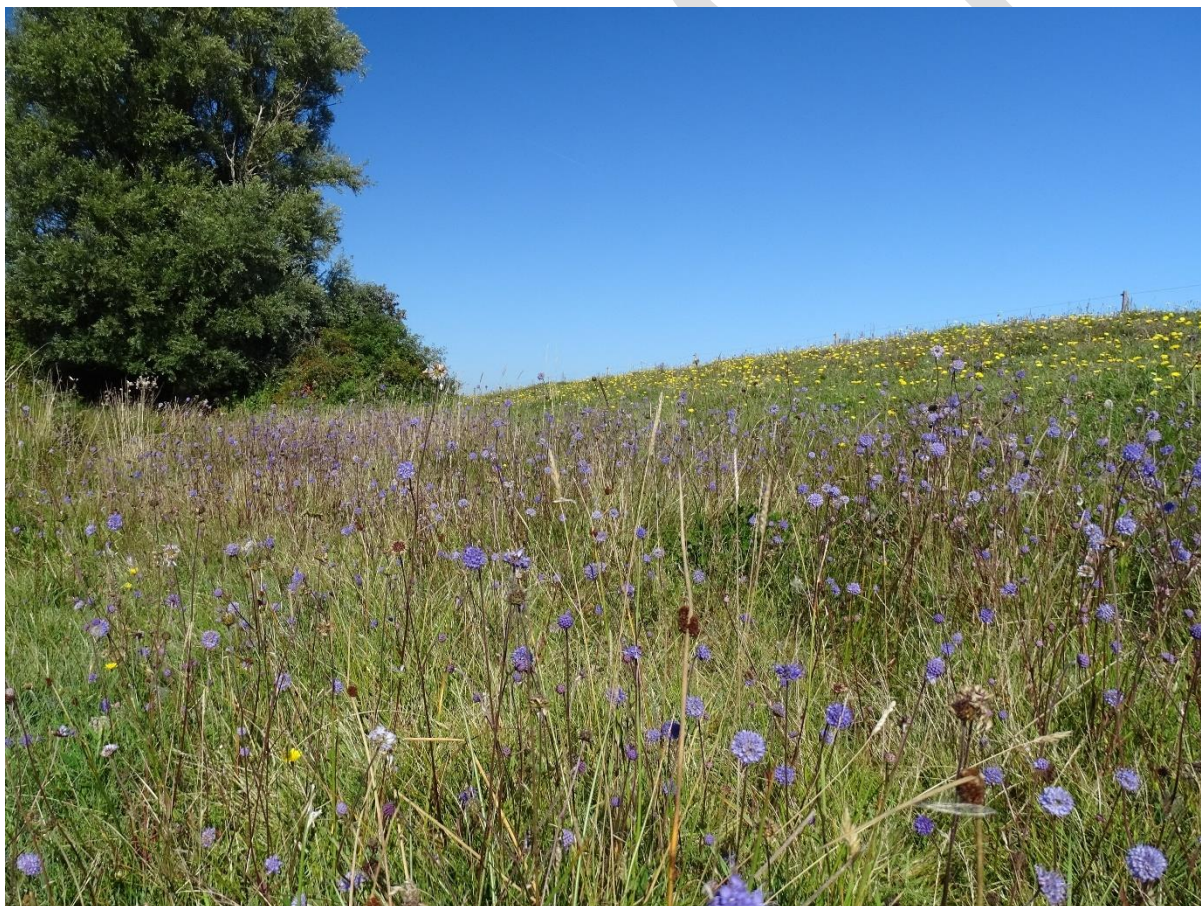
Langs Langemose løber en lang bræmme med en stor bestand af djævelsbid ( Succisa pratensis ).

Den væsentligste naturforvaltningsmæssige opgave i området knytter sig til at fastholde og sikre en hensigtsmæssig drift/pleje af de sammenhængende lysåbne naturtyper.