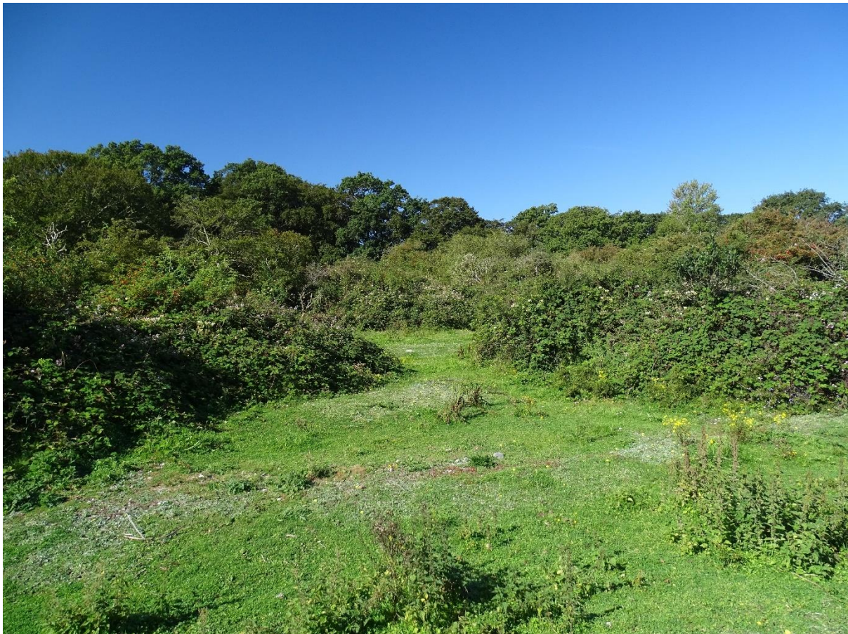
Strandeng ved Bøgebjerg tilgroet med brombær ( Rubus sp.) og slåen ( Prunus spinosa ).