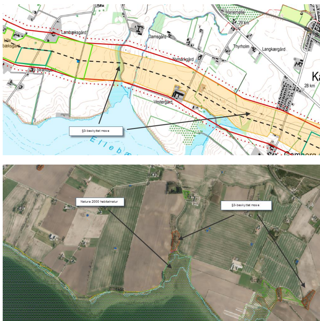
Figur 1: Rørføring tværs over §3-beskyttede naturområder

Det findes meget uforstående, hvordan en virksomhed kan få lov til at påvirke miljøet i sådan en retning, når andre virksomheder er underlagt at overholde naturbeskyttelseslovens gældende regler.