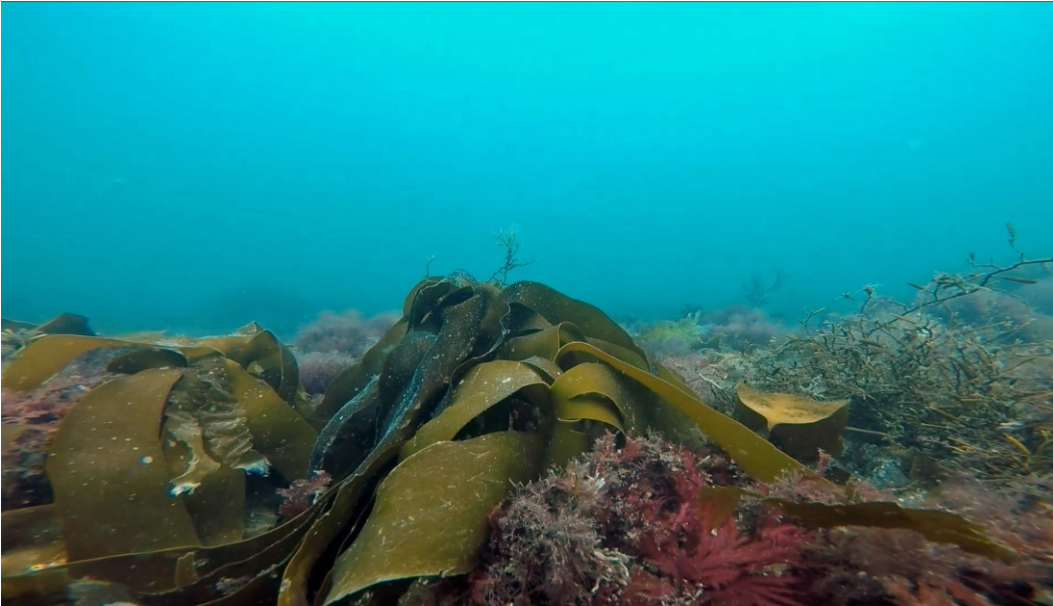
Naturtypen stenrev der findes i området.