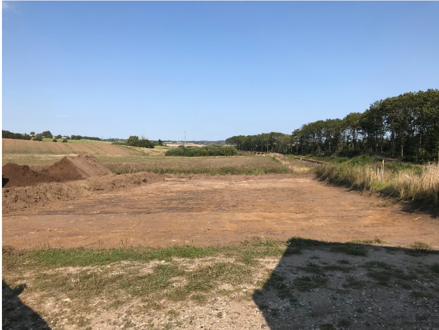
Foto den 21. september 2020 – fotos taget fra syd mod nord. Område, der tilplantes – mod øst ses banen og det fredskovspligtige areal med højstammede træer. Der er endvidere midlertidigt dispenseret til oplagsplads for materiel i forbindelse med elektrificering af jernbanen fra Aarhus til Lindholm.