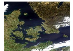
Satellit billede over de indre danske farvande