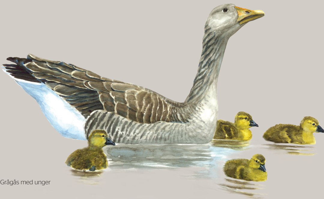
Grågås med unger

I hele reservatet er det forbudt at udøve jagt eller på anden måde at ombringe eller forjage svømme- og vadefugle. Jagt på andre arter er kun tilladt i jagttiden fra 1. oktober. Sejlads på søen er kun tilladt for lodsejere.