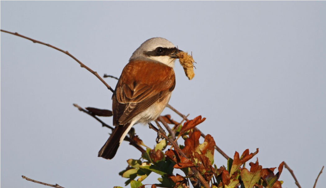
Rødrygget tornskade ses i området.

De centrale mosearealer er nedbrudt højmoser med spredte tørvegrave, brunvandede søer og store andele af skovbevokset tørvemose. Randarealerne er lavtliggende marginaljord, som drives ekstensivt. Begge områder er afvandet gennem et netværk af grøfter. Bunden i moserne udgøres af op til 1,5 m søkalk, som er blevet udnyttet i mosens sydlige del. Her findes åbne arealer med engrørhvene og tagrørs-bevoksning eller hængesæk og tørvegrave med bl.a. krebsklo.