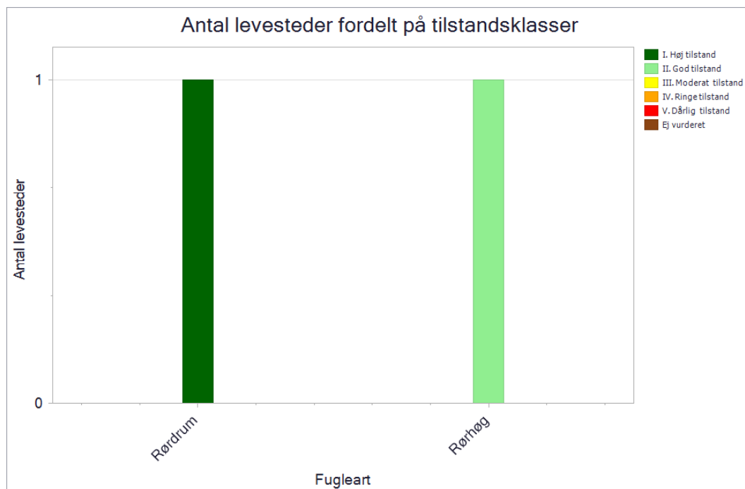
Antal og tilstand af de kortlagte levesteder for ynglefugle.

De enkelte levesteders tilstand kan ses på Miljøstyrelsens digitale kort i MiljøGIS .