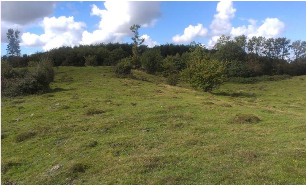
Rødme Svinehaver. Surt overdrev med tuer af gul engmyre.

Natura 2000-planens målsætninger og indsatsprogram er væsentlige elementer i beskyttelsen af disse og af en generel sikring og forbedring af områdets naturværdier.