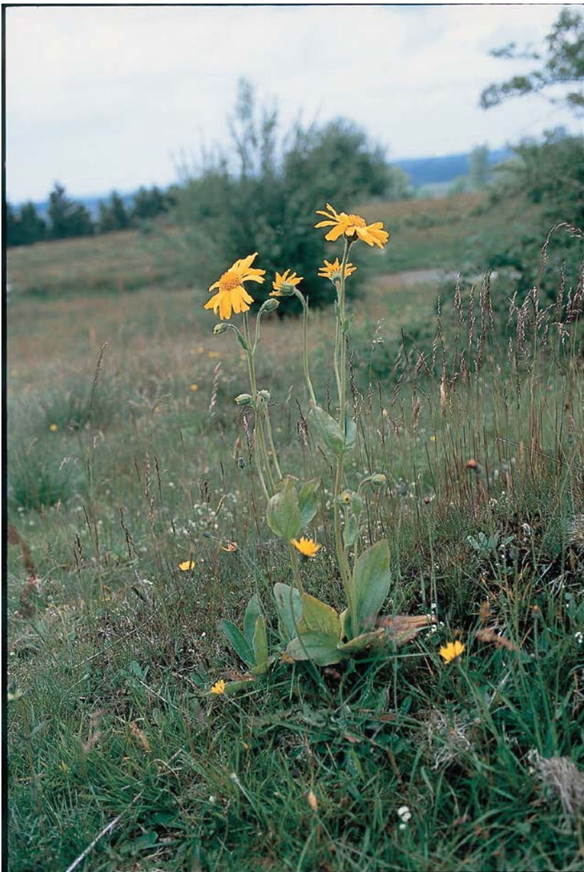
Guldblomme er en af de karakteristiske arter for surt overdrev og findes i en meget stor bestand i Rødme Svinehaver, hvor den har sit eneste voksested på Fyn. Arten har i de seneste år bredt sig til det tilstødende areal, som i år 2003 blev omlagt fra agerjord til vedvarende græsareal.

Det er en fælles opgave for kommuner og offentlige lodsejere at aftale nærmere på hvilke arealer og i hvilke kommuner, den konkrete indsats skal foregå.