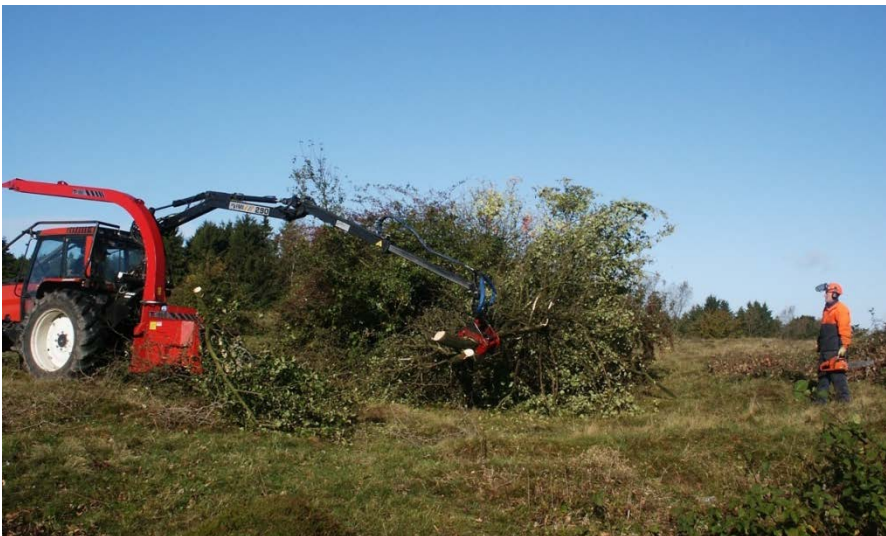
Det er nødvendigt at foretage regelmæssige rydninger af opvækst af træer og buske for at bevare de lysåbne overdrev i Rødme Svinehaver.

Rydning af elle- og askeskove til genskabelse af rigkær kan ske under forudsætning af, at arealet af skovnaturtypen opretholdes på nationalt biogeografisk niveau.