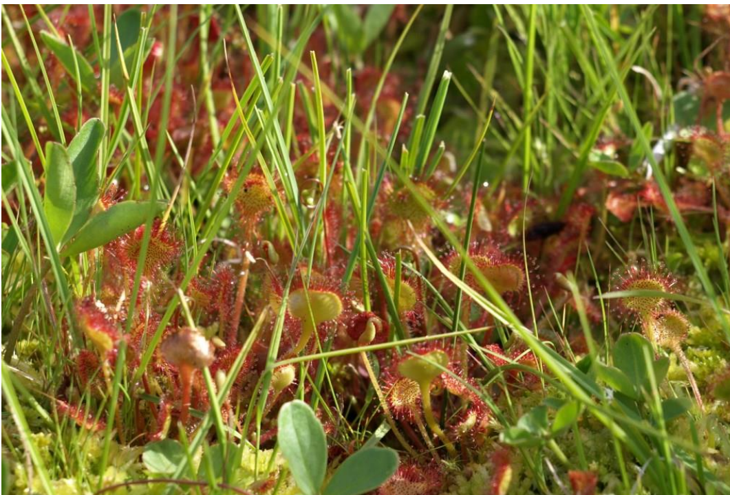
Rundbladet soldug vokser i hængesæk i Rødme Svinehaver.

Naturtyper der udgør det gældende udpegningsgrundlag for Natura 2000-området. Tal i parentes henviser til de talkoder, som benyttes for naturtyper fra habitatdirektivets bilag 1. * angiver at der er tale om en prioriteret naturtype. Udpegningsgrundlag for habitatområder og fuglebeskyttelsesområder er blevet revideret som beskrevet i basisanalysen.