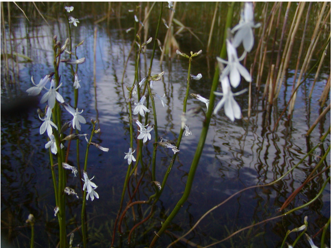
Tvepibet lobelia er karakterart for Navnsø.