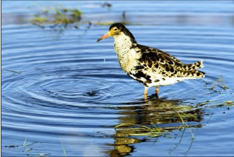
Den sjældne ynglefugl brushane foretrækker lokaliteter med høj vandstand og lav vegetation.