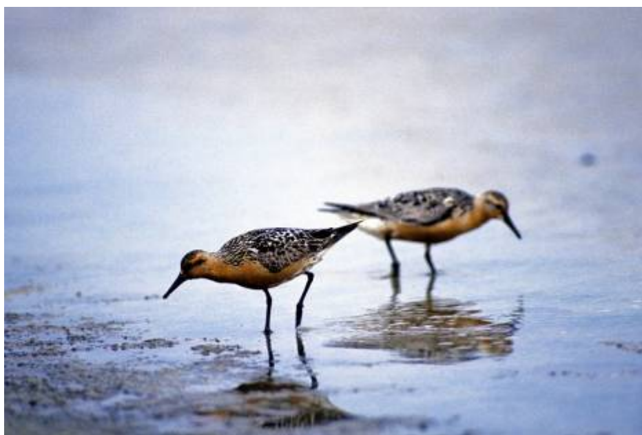
Islandsk ryle er en af de mange vadefuglearter af trækfugle, som raster i området.

I bilag 1 findes et oversigtskort over habitatområde H78 og fuglebeskyttelsesområderne nr. F49, F51, F52, F53, F55, F57, F60, F65 og F67, samt habitatområderne H86, H90 og H239.