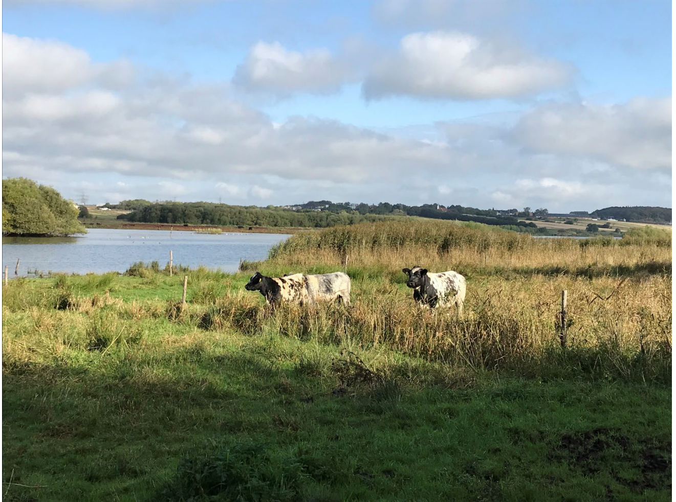
Foto græssende dyr ved Årslev Engsø