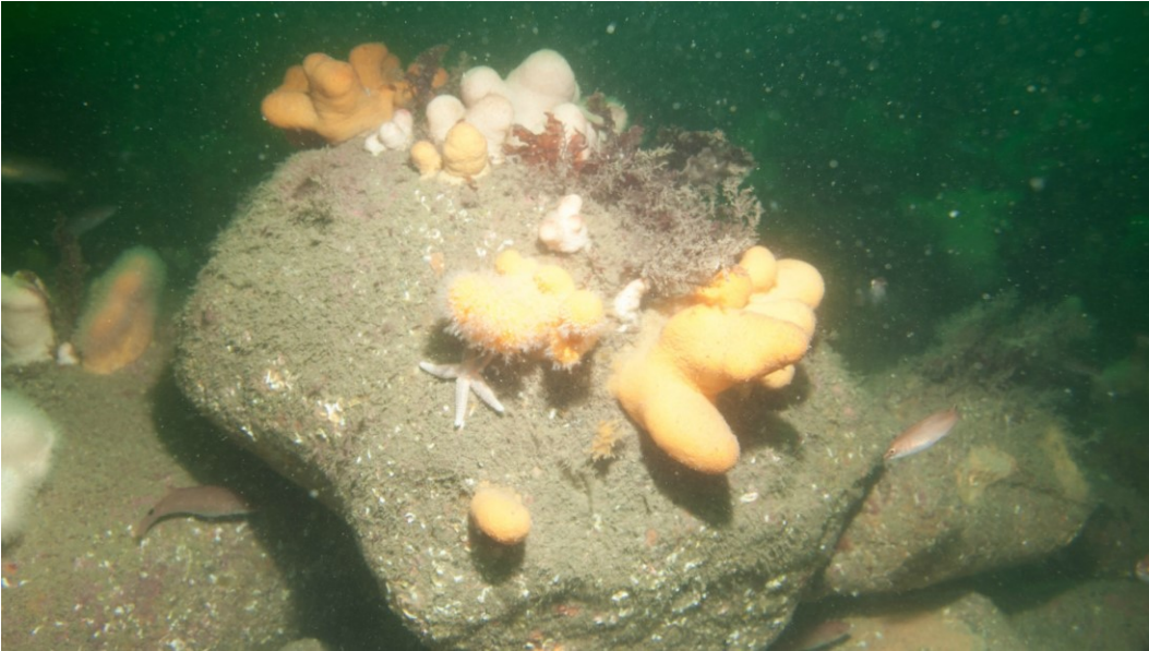
Dødningehånd på stenrev.