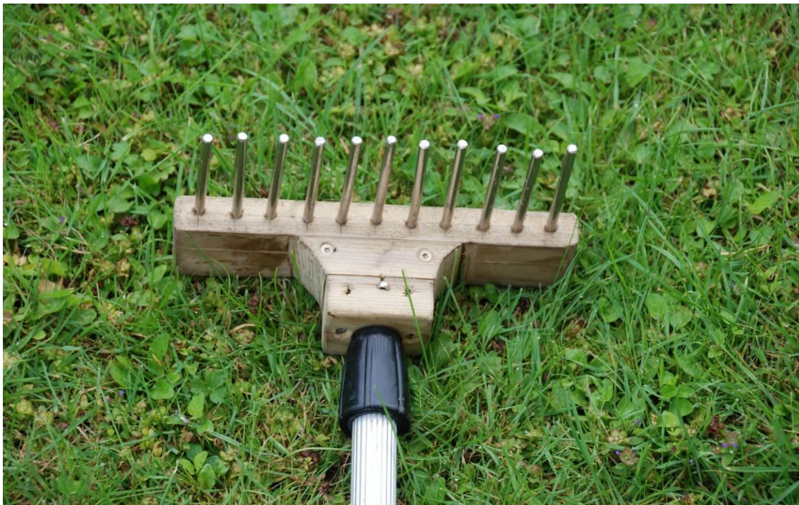
Figur 3. Planterive monteret på teleskopstang særlig velegnet til brug ved registrering af planter, substrat og dybde fra båd – hvor vandet er uklart eller for dybt til brug af vandkikkert. Rivehovedet har følgende dimensioner: Bredde – 200 mm, tændernes længde – 80 mm, tykkelse – 6 mm, afstand mellem tænder – ca. 13 mm.

forhold til båden mindst 10-15 steder (10 hvis vandløbet er < 20 m bredt, 15 hvis det er \geq 20 m bredt) jævnt fordelt på tværs af vandløbet. Dette foretages mest hensigtsmæssigt, når båden fires tilbage til udgangspunkt langs et givet transekt, inden den flyttes til det næste transekt. Den samlede dækningsgrad udregnes som gennemsnittet af de skønnede dækningsgrader for hvert af de 5 "transekt-mellemrum".