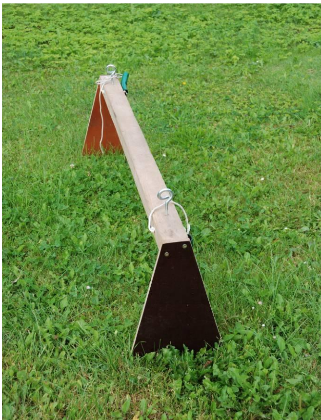
Figur 2. Bom til fastgørelse af tov/wire ved brug af gummibåd i ikke-vadbare vandløb. Bommen placeres på tværs af gummibåden – umiddelbart bag sædet. Bommen skal være så bred, at den lige akkurat kan "klemmes" ned over undersiden af båden. Bom

Succesen af målingerne afhænger af, om det er muligt at se bunden. Der skal derfor – så vidt muligt – vælges tidspunkter til undersøgelserne, hvor vandet er klart, og vanddybden ikke er uforholdsmæssigt høj (efter kraftige regnhændelser og lignende).