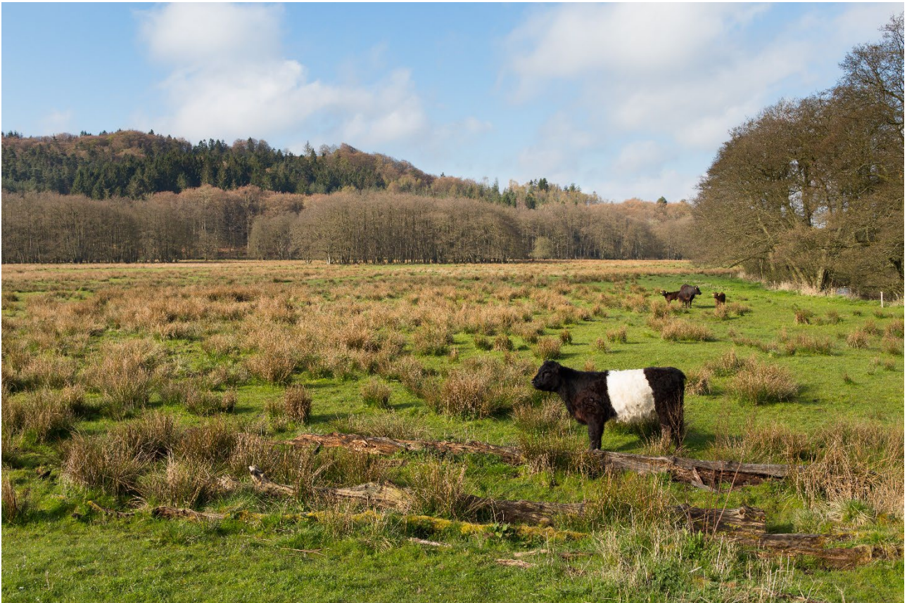
Græssende gallowaykvæg i Klosterkær ved Mossø.