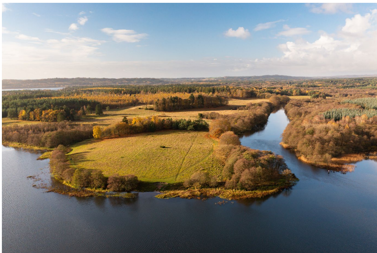
Gudenåens udmunding i Gudensø med det store statsejede overdrevslandskab ved Dalgård og Odderholm.

Der kan være indsatser i Natura 2000-planens indsatsprogram, hvor der ikke er samme klare geografiske afgrænsning. I denne handleplan er der en naturlig ansvarsfordeling ud fra den geografiske afgrænsning, og dermed hvilken myndighed, der er ansvarlig for gennemførelse.