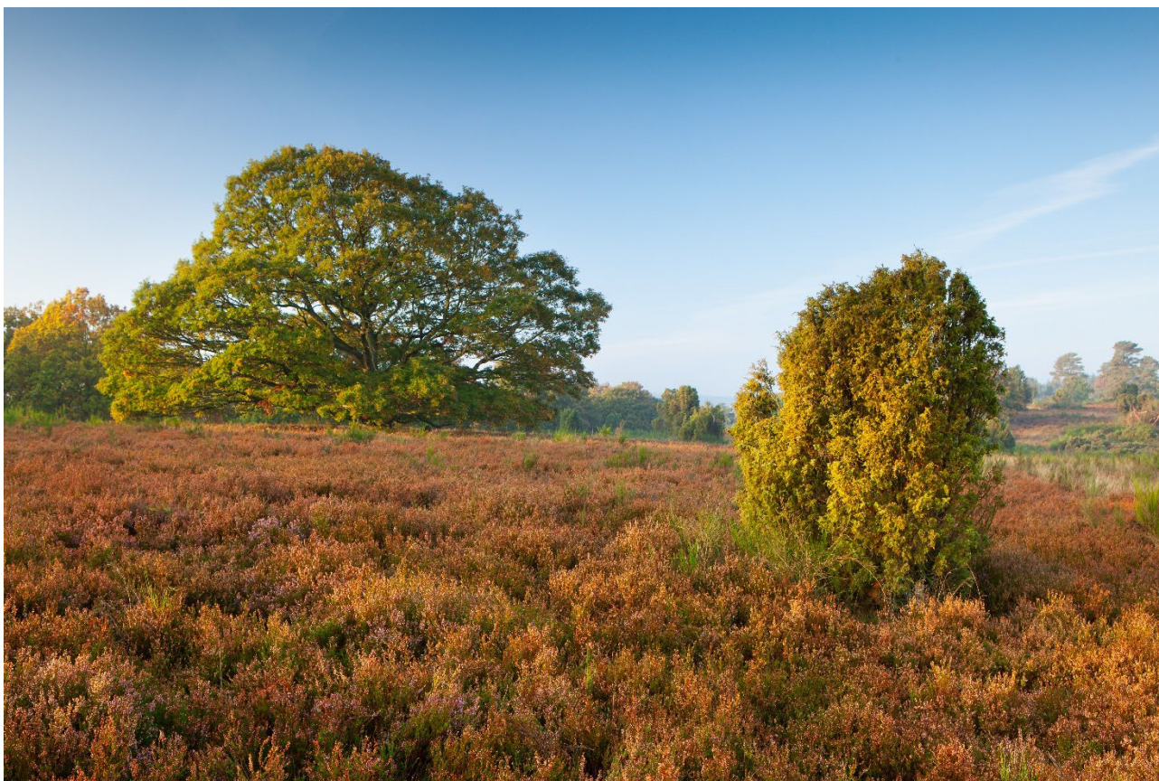
Tør hede med spredte egetræer og enebuske ved Salten Langsø.

Indsatserne på de lysåbne arealer vurderes ligeledes at være til gavn for de arter der er tilknyttet habitatnaturtyper. Der lægges bl.a. vægt på, at der på hede- og overdrevsarealer efterlades buske til f.eks. rødrygget tornskade.