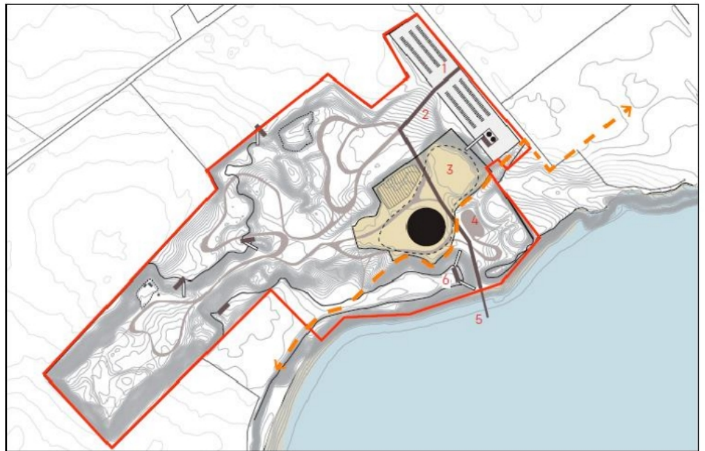
Fig. 2. Situationsplan af Boesdal fra ansøgningsmaterialet i 2015. Situationsplan med markering af landgangsbro (nr. 5 på skitsen).