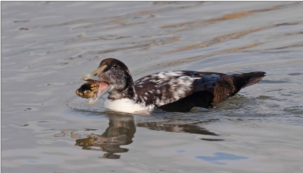
Edderfugl benytter området som raste- og fourageringsområde. Området giver fuglene gode muligheder for at finde føde og uforstyrrede raste- og overnatningsmuligheder.