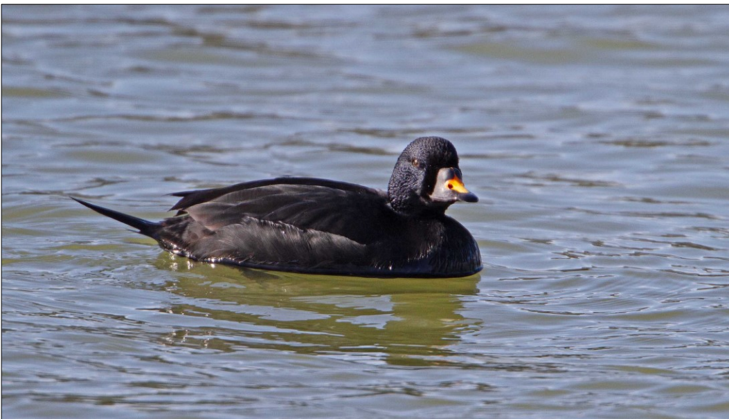
Sortand har en væsentlig international forekomst i området, og som de øvrige havdykænder benytter den området til fouragering og som rasteområde.

Der vurderes ikke at være modstridende interesser mellem de enkelte elementer på dette Natura 2000-områdes udpegningsgrundlag.