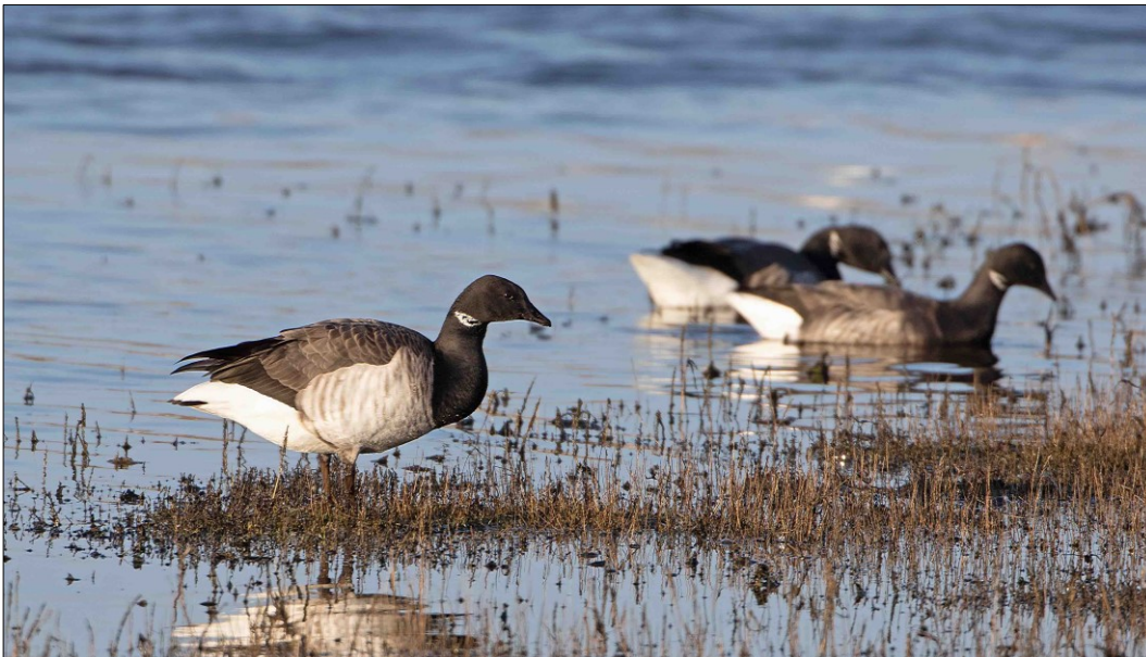
Lysbuget knortegås raster og overmatter ved de lavvandede kystområder langs Djurslands nordkyst, hvor arten især ses fouragerende på ålegræsbelterne og på strandengene i området.

Vandområdeplanernes indsatser bidrager både med foranstaltninger til at undgå yderligere forringelser og med foranstaltninger til genopretning af bevaringsstatus. Indsatserne kan eksempelvis være reduktion af kvælstof- og fosforbelastningen til søer, reduktion af tilledningen af organisk stof til vandløb samt reduktion af kvælstofbelastningen til marine vandområder. Hertil kommer fx genslyngning af vandløb og fjernelse af spærringer. De konkrete indsatser for planperioden 2022-2027 er beskrevet i de nye vandområdeplaner og fremgår af indsatsbekendtgørelsen. Indsatserne vil også blive præsenteret i MiljøGIS for vandområdeplanerne på Miljøstyrelsens hjemmeside .