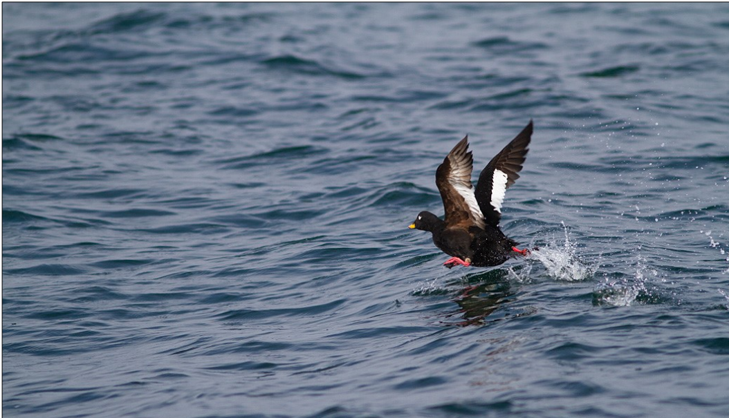
Fløjsand raster og overvintre i området og har en bestand af national betydning i området.

Udvalgte forvaltningsbare parametre i tilstandssystemet gennemgås i basisanalyserne, og det kan heraf ses hvilke tiltag, der kan iværksættes for at sikre eller genoprette naturtyperne eller arterne/fuglenes levesteder.