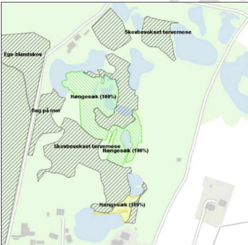
Figur 5. Lysåbne naturarealer og skovnaturtyper

Mindre dele af den udpegede skovbevoksede tørvemose ud mod eksisterende hængesæk plejes i dag som udvidelse/bevarelse af lysåben hængesæk. Dette er en bevidst prioritering i henhold til Naturplanen, da det anses for mere vigtigt at udvikle og bevare hængesæk fladerne end den skovbevoksede tørvemose, der hvor de 2 naturtyper konkurrerer om pladsen.