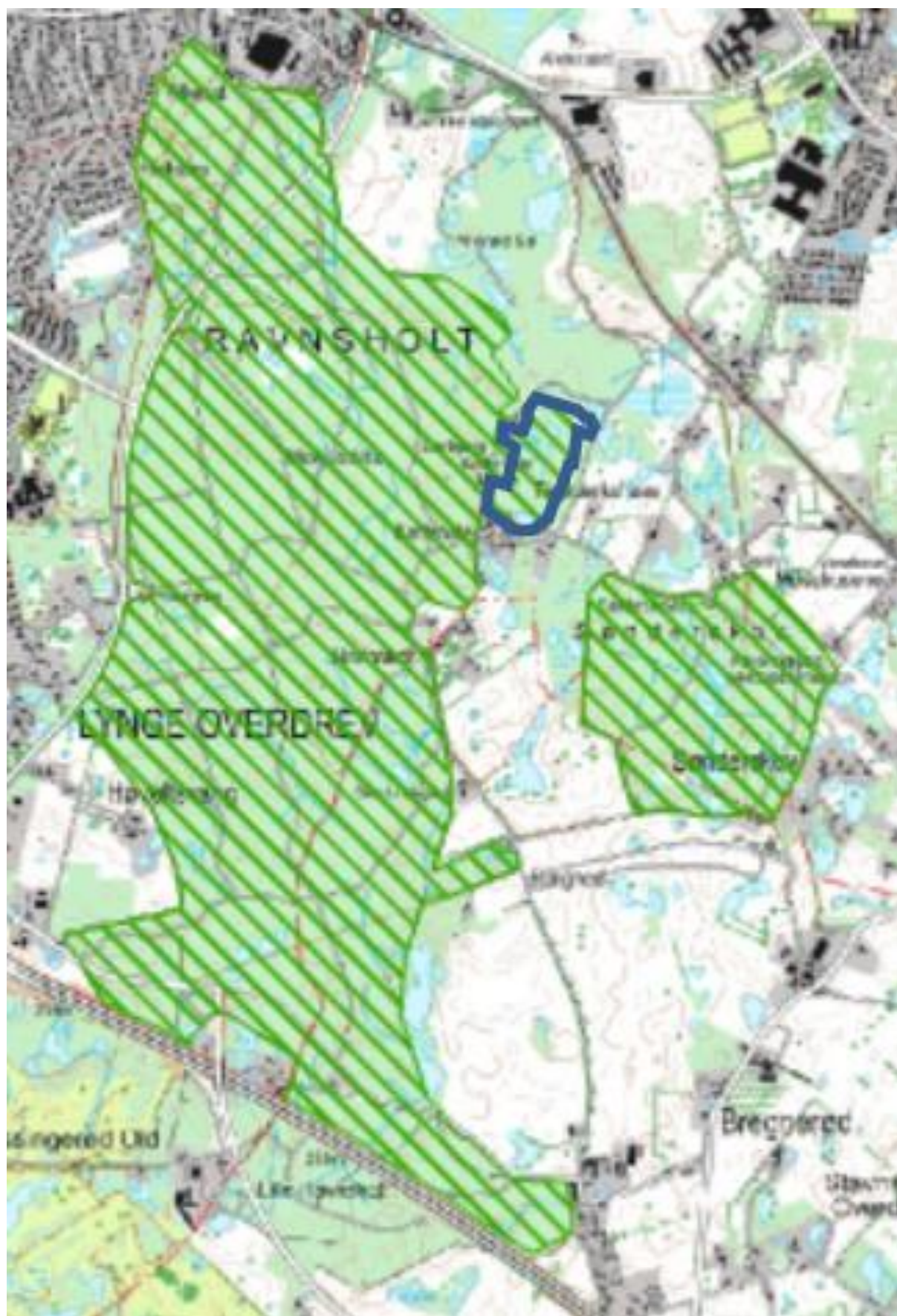
Figur 2. Natura 2000 område 137 med skraveret grønt. Denne rapport omhandler det med blå markerede areal der omfatter private og kommunalt ejede arealer. Resterende arealer i Natura 2000-område nr. 137 er statsejede fredsskovarealer, hvor Naturstyrelsen udarbejder drifts- og plejeplan.