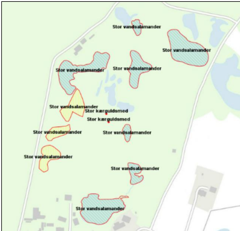
Figur 3. Kortlagte potentielle levesteder for stor vandsalamander samt fund af stor kærguldmed.