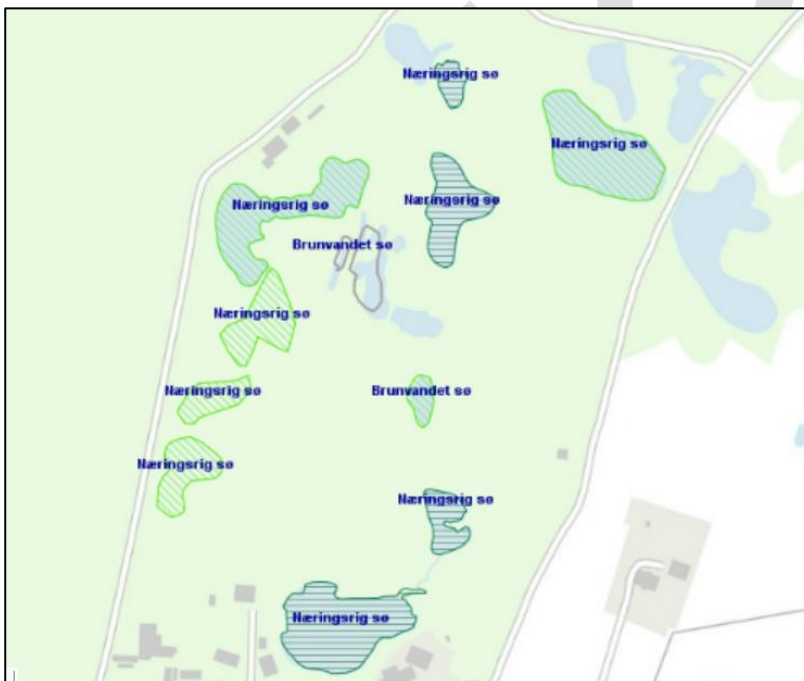
Figur 4. Kortlagte søer under 5 ha. Brunvandet sø mod nord opfattes af Allerød Kommune som flere små søer i tabel 4.

På skovbevoksede arealer vil mange af de tiltag, der implementeres for skovnaturtyperne også være gavnlige for de arter, der er knyttet til naturtyperne. I nedenstående gennemgås eksempler på indsatser, der også gavner arter, hvor indsatserne i forvejen gennemføres i området jf. Natura 2000-planen.