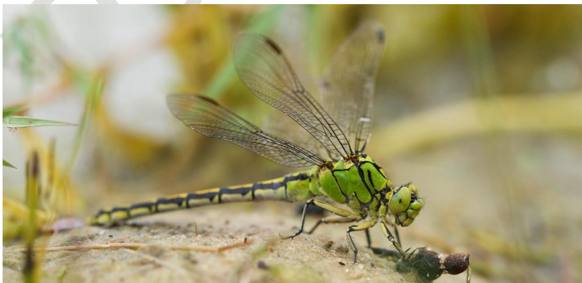
Grøn kølleguldsmed, som er på udpegningsgrundlaget for 2000-området.

For samtlige Natura 2000-planer er der foretaget en strategisk miljøvurdering (SMV). Natura 2000-planerne og de tilhørende miljøvurderinger kan findes på Miljøstyrelsens hjemmeside under Natura 2000, tredje generation planer (2022-2027).