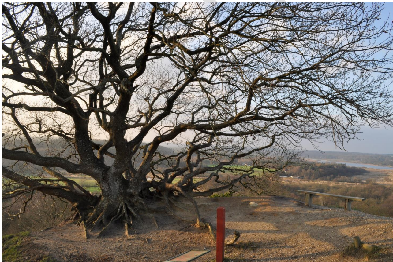
Udsigten fra Store Troldehøj i Gjærn Bakker.

Lige så vel vurderes synergien mellem Natura 2000- og Vandplanindsatsen at sikre bæklampret og odder gode forhold i habitatområdet.