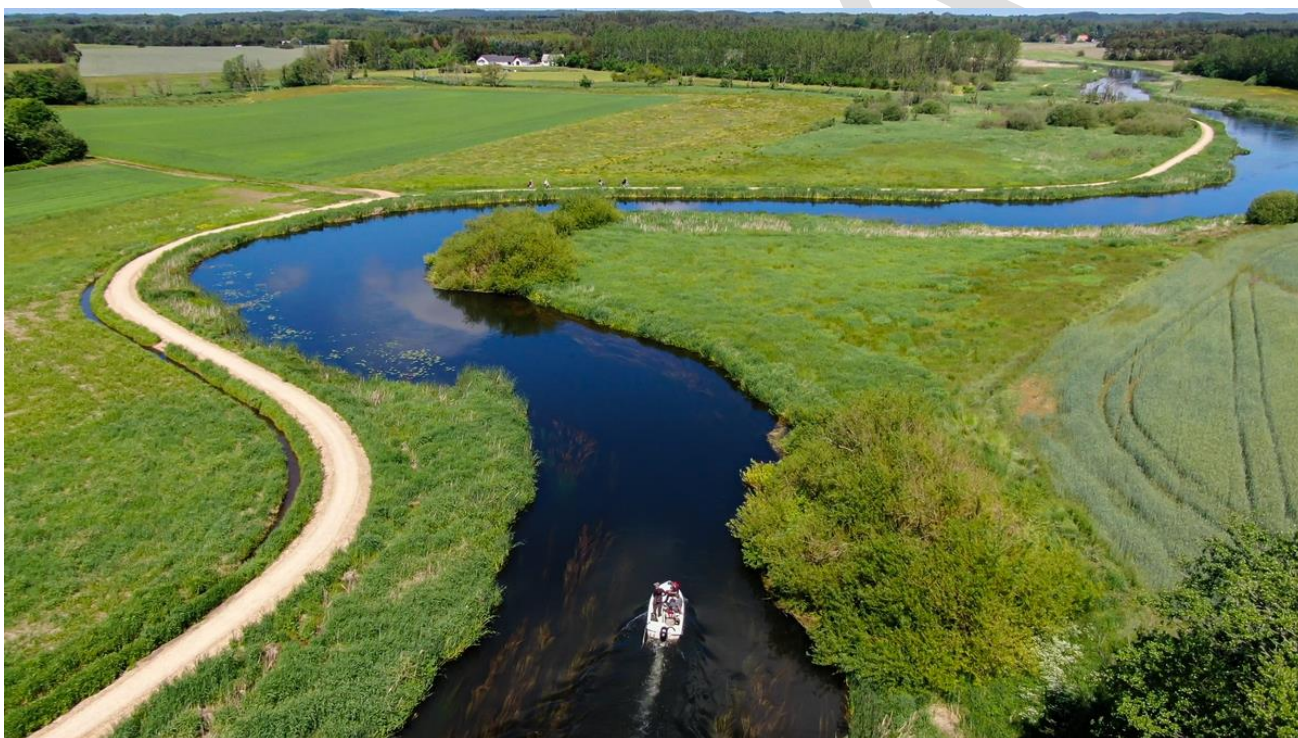
Foto af Gudenåen og Trækstien syd for Kongensbro.

Effekten af indsatserne bliver løbende vurderet i det Nationale Overvågningsprogram for Vandmiljø og Natur (NOVANA), som overvåger vandmiljøets og naturens tilstand inden for de områder, der prioriteres i forhold til de politisk fastsatte økonomiske rammer.