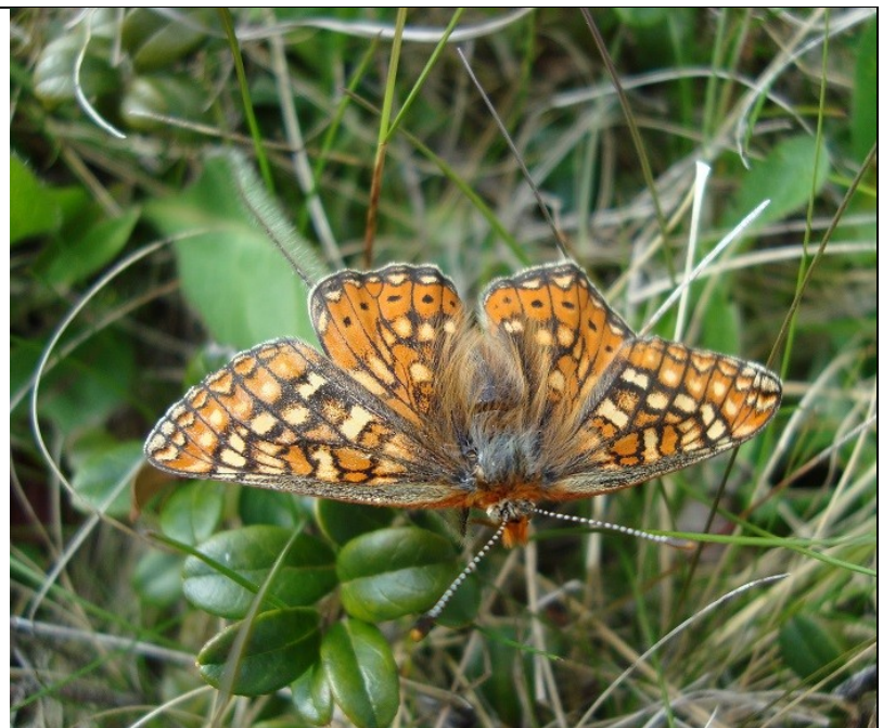
Guldblomme og hedepletvinge.