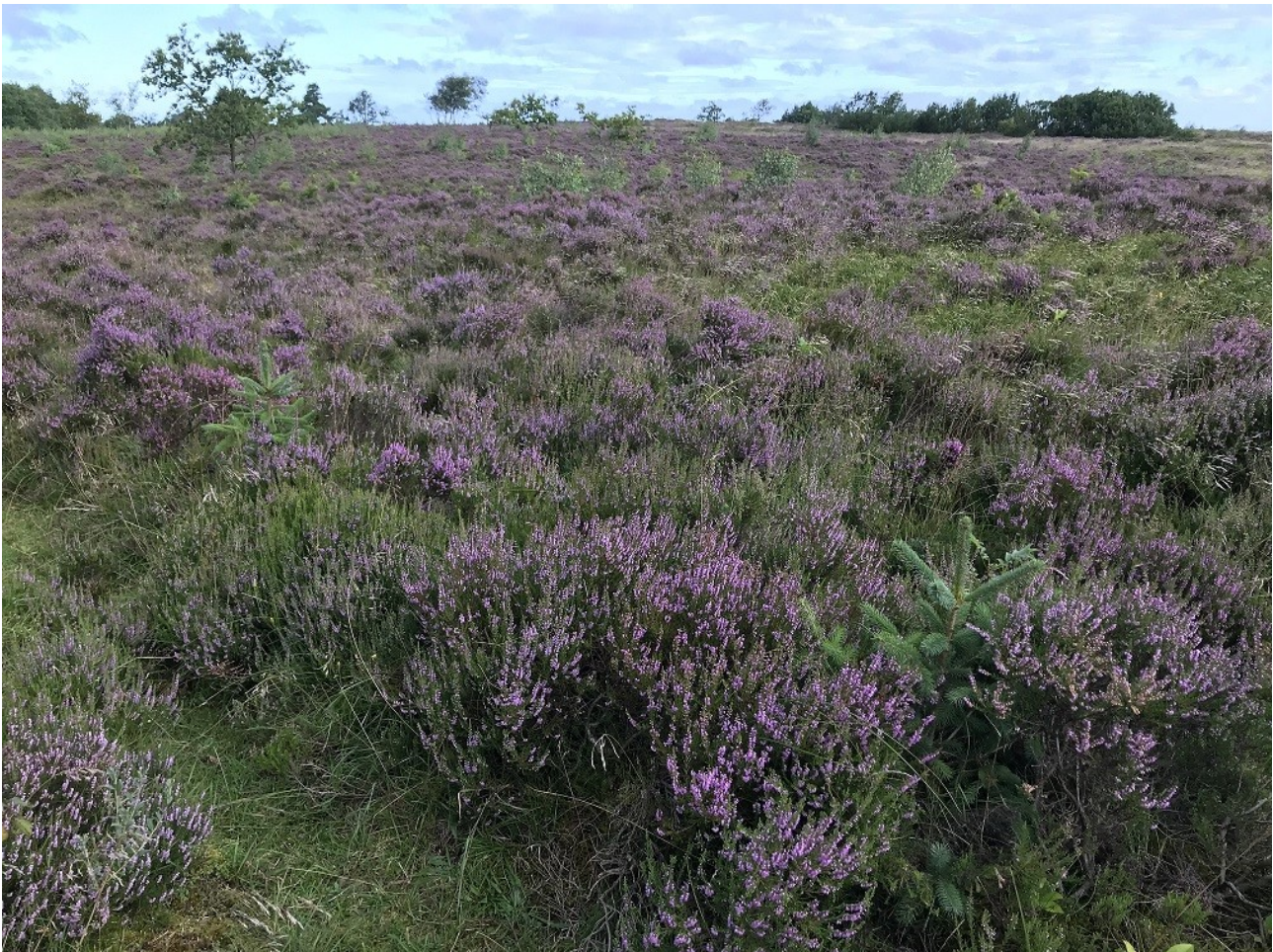
Oudrup Østerhede