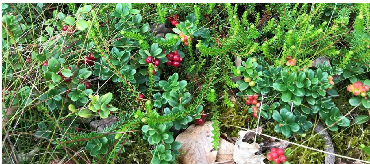
Revling og tyttebær.

Projekterne gennemføres som udgangspunkt ved frivillige aftaler, og derfor er det i mange tilfælde ikke på nuværende tidspunkt muligt at beskrive, hvornår projekterne fysisk bliver udført. Kommunerne og Miljøstyrelsen vil i hvert enkelt tilfælde sørge for, at relevante interessenter bliver inddraget.