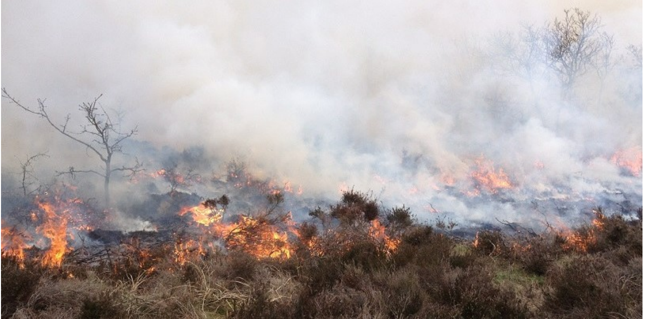
Afbrænding af gammel lyng.