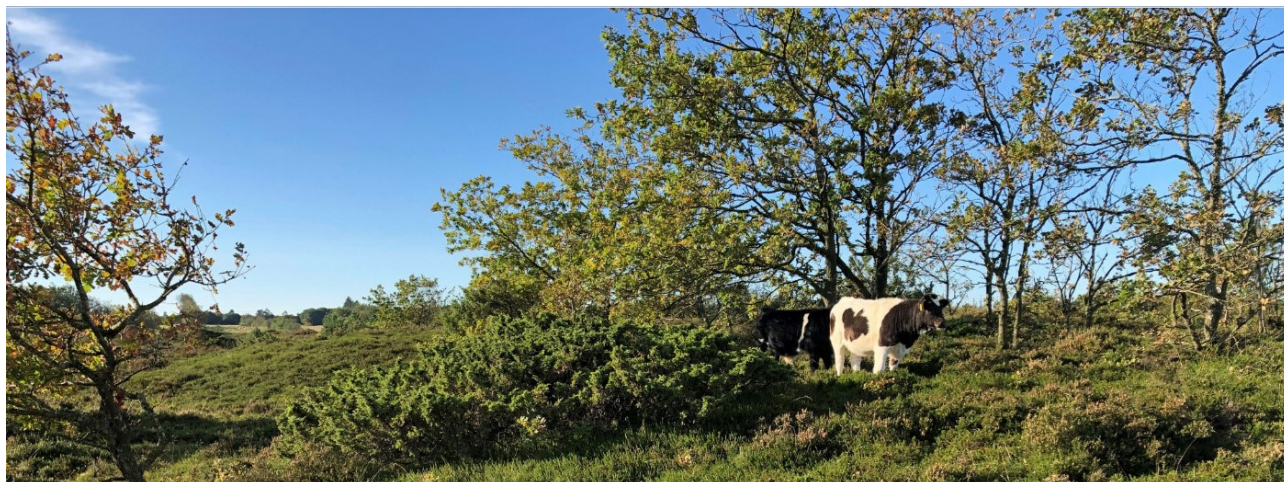
Afgræsning på Ajstrup Hede.

Effekten af indsatserne bliver løbende vurderet i det Nationale Overvågningsprogram for Vandmiljø og Natur (NOVANA), som overvåger vandmiljøets og naturens tilstand inden for de områder, der prioriteres i forhold til de politisk fastsatte økonomiske rammer. I dette område er der foretaget overvågning i 2017 suppleret med undersøgelse af de nyudpegede Natura 2000-delområder i 2019.