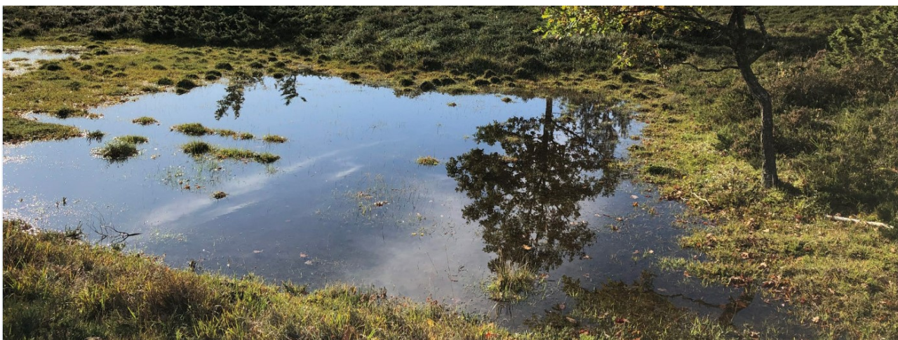
Vandhul på Ajstrup Hede.

For samtlige Natura 2000-planer er der foretaget en strategisk miljøvurdering (SMV). Natura 2000-planerne og de tilhørende miljøvurderinger kan findes på Miljøstyrelsens hjemmeside under Natura 2000, tredje generation planer (2022-2027).