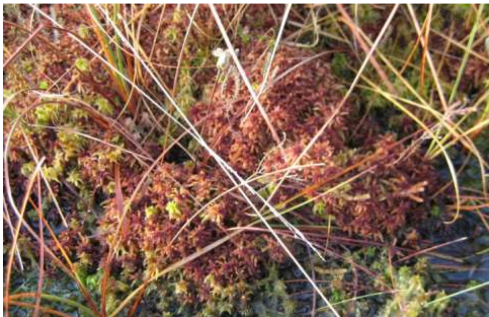
Sådan vokser højmosen i Kongens Mose.

Vandplanen: Regulerer tilførslen af næringsstoffer til søer.