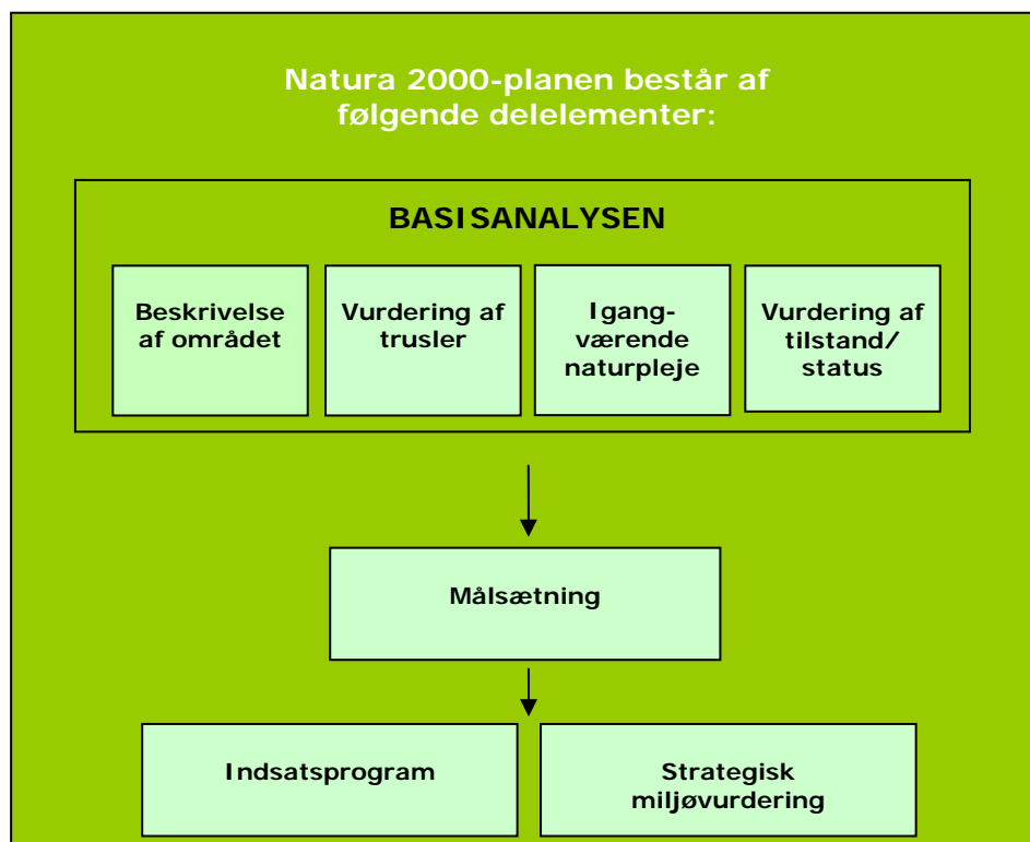
Figur 1. Opbygning af en Natura 2000-plan.

Planen omfatter "udpegningsgrundlaget", dvs. de naturtyper og arter, som området er udpeget for. Natura 2000-planens indhold er vist i figur 1.