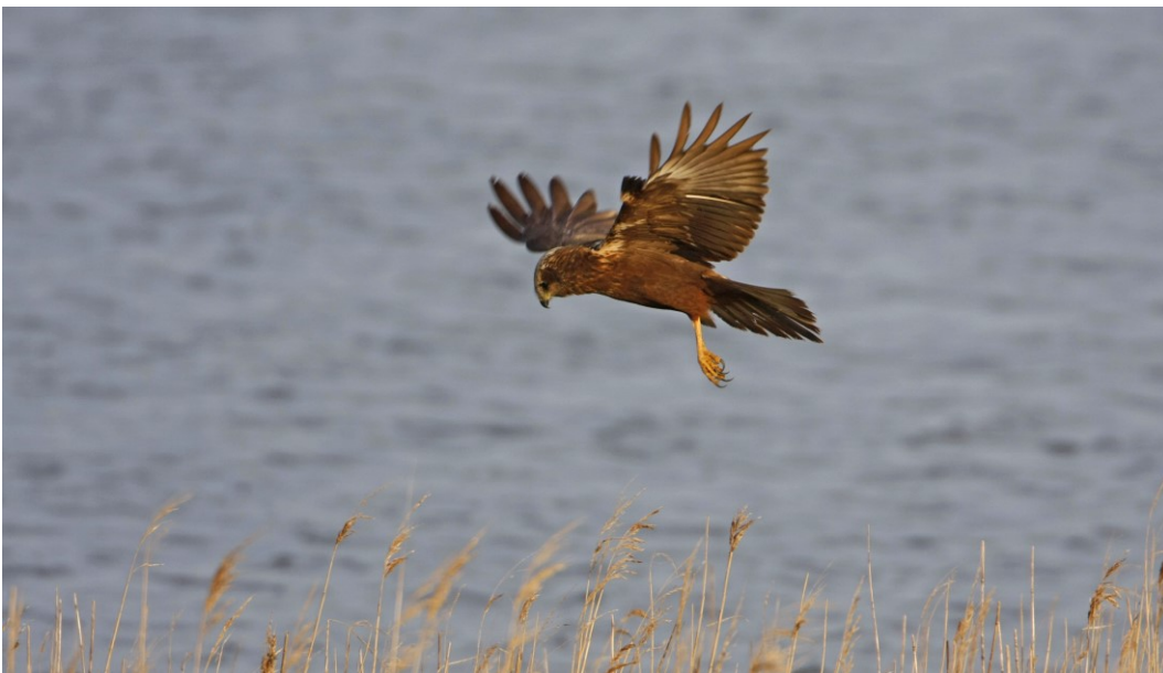
Rørhøg yngler uregelmæssigt i fuglebeskyttelsesområdet.

Natura 2000-området er en nedbrudt højmoser under tilgroning med blandt andet birk og græsser. Stedvis kan tue- og højlestrukturer stadig findes, ligesom en lang række karakteristiske arter for højmoser fortsat er til stede. Samtidig sker der særligt i den sydlige del en næringsberigelse, som ændrer vegetationens sammensætning til fordel for mere næringskrævende arter. Mosen og det omgivende terræn er fladt. Den nordlige del af mosen (Skast Mose) afvandes mod nord til kanalen Hørmøls. Den centrale og sydlige del (Kogsbøl Mose) afvandes mod syd til Vestre Randkanal. En asfalteret vej fører ind til den centrale del af mosen og vidner om tidligere tiders tørvegravningsvirksomhed i området.