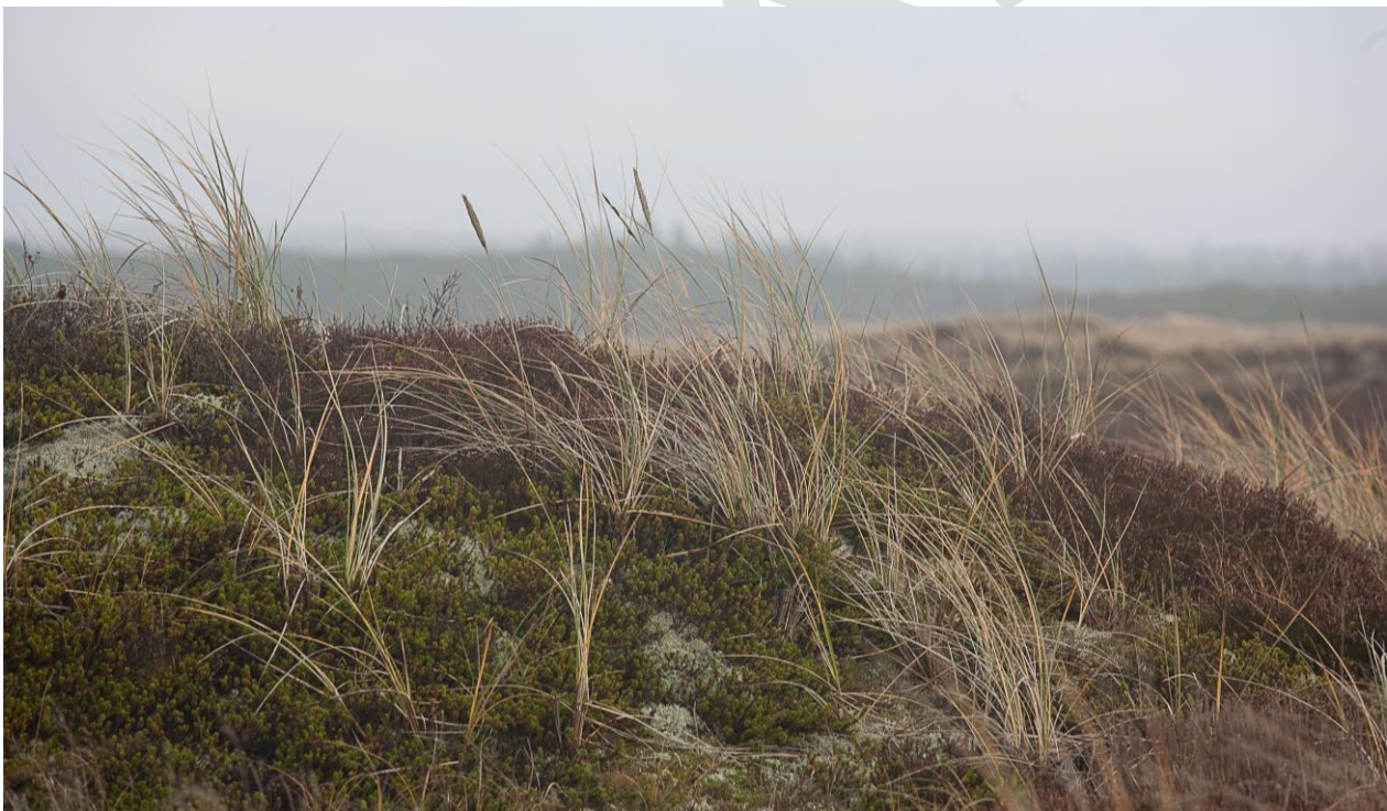
Klitlandskab i Hanstholm Reservatet. Klithede er en af de prioriterede naturtyper indenfor området.