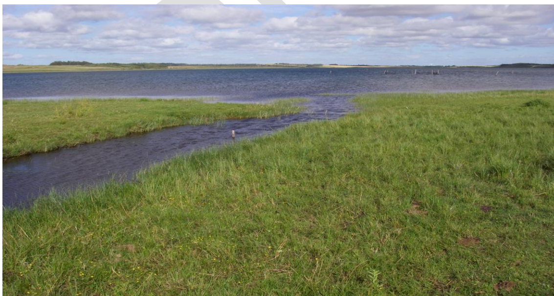
Udsigt over Nors sø, som er levested for liden najade.

Bilag 6 viser krav til levested for arterne i indsatsprogrammet samt mulige indsatser til forbedring af disse. Lodsejere med kendskab til specifikke arter på deres arealer kan her se mulige forslag til hvordan de kan tilgodese arten.