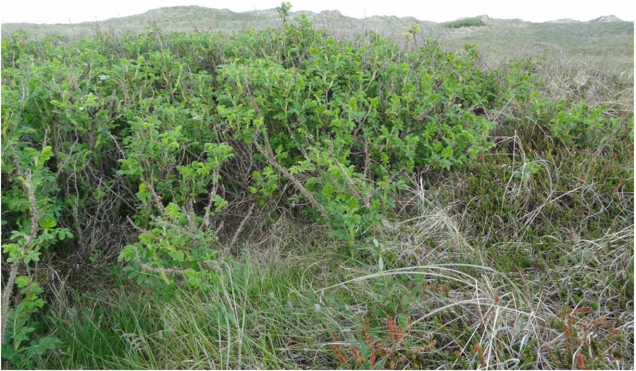
Rynket rose er en invasiv art som findes i Natura 2000-området.