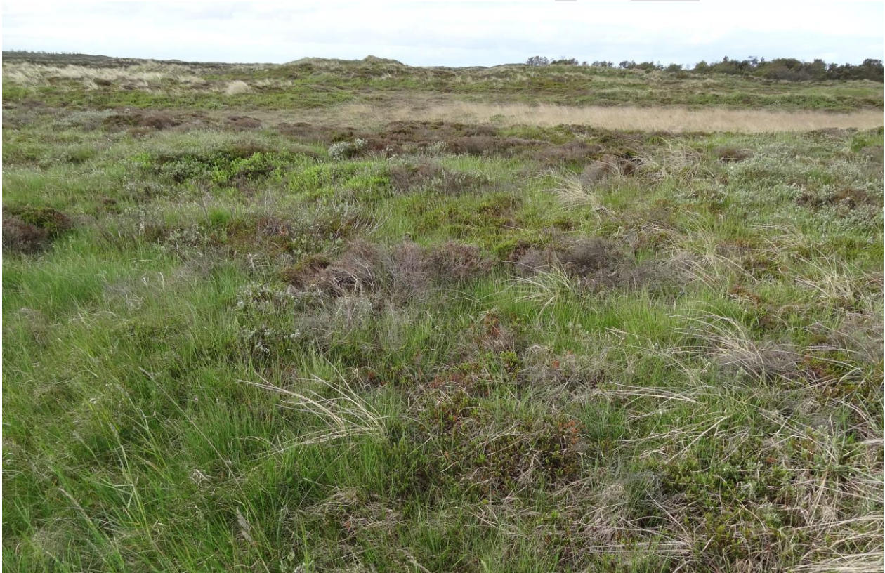
Klithede syd for Lyngby. Klithede er en af de prioriterede naturtyper der er på udpegningsgrundlaget for området.

Indsatsen vil helt overvejende dreje sig om at sikre de lysåbne naturtyper ved drift/pleje af naturtyperne f.eks. i form af græsning og rydning af opvækst samt gennemføre en indsats over for invasive plantearter. Vandafhængige naturtyper skal sikres den for naturtyperne mest hensigtsmæssige hydrologi. For skovnaturen sikres en naturtypebevarende drift. Der sikres velegnede levesteder for stor vandsalamander som er på områdets udpegningsgrundlag.