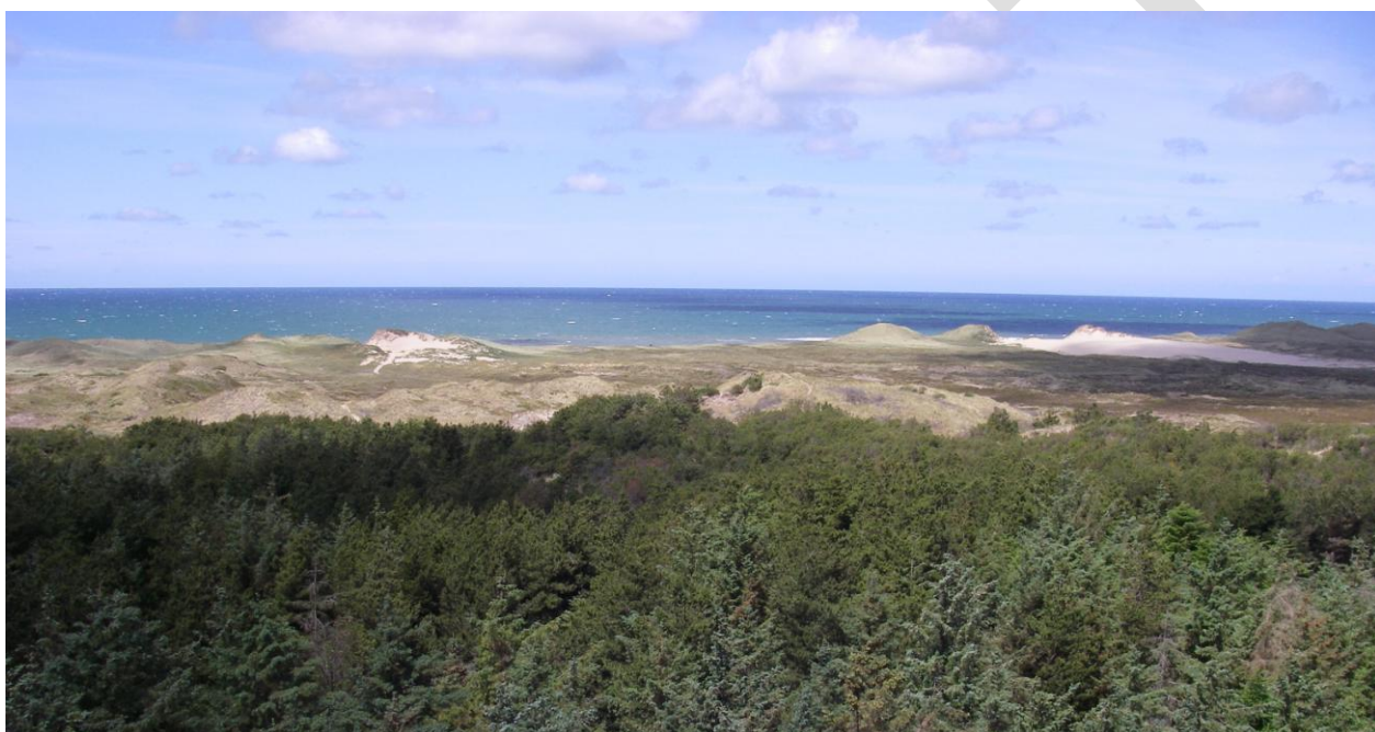
Udsigten fra Lodbjerg Fyr ud over klit landskabet og Vesterhavet.

I handleplanen anvendes en række Natura 2000-begreber m.m., som er defineret nærmere i bilag 5.