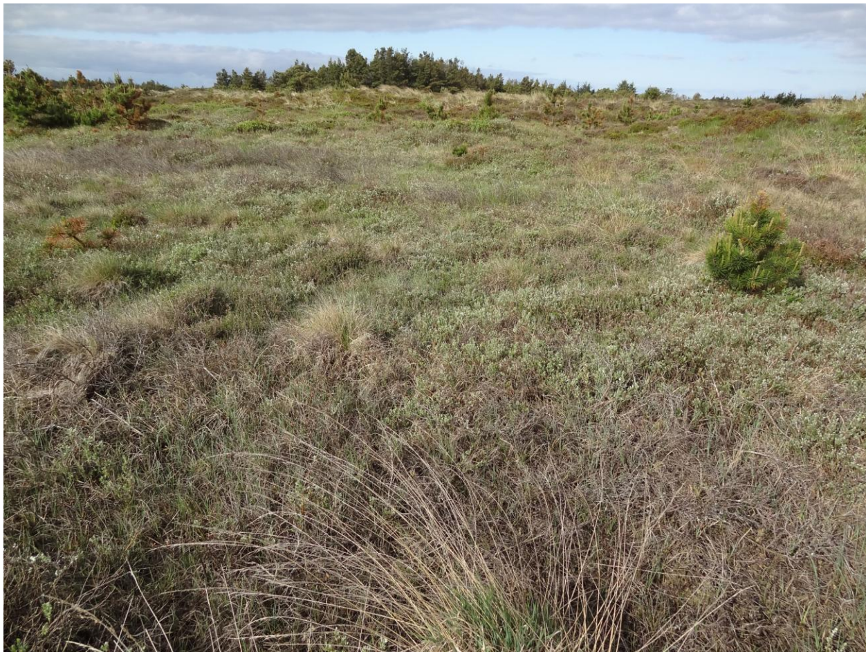
Klitlandskab syd for Lyngby. Bjergfyr i forgrunden.

Mere naturlige vandstandsforhold kan være en afgørende forudsætning for, at våde naturtyper som f.eks. klitlavning og våd hede kan opnå gunstig bevaringsstatus. Dette gælder også for en række arter tilknyttet våde naturtyper.