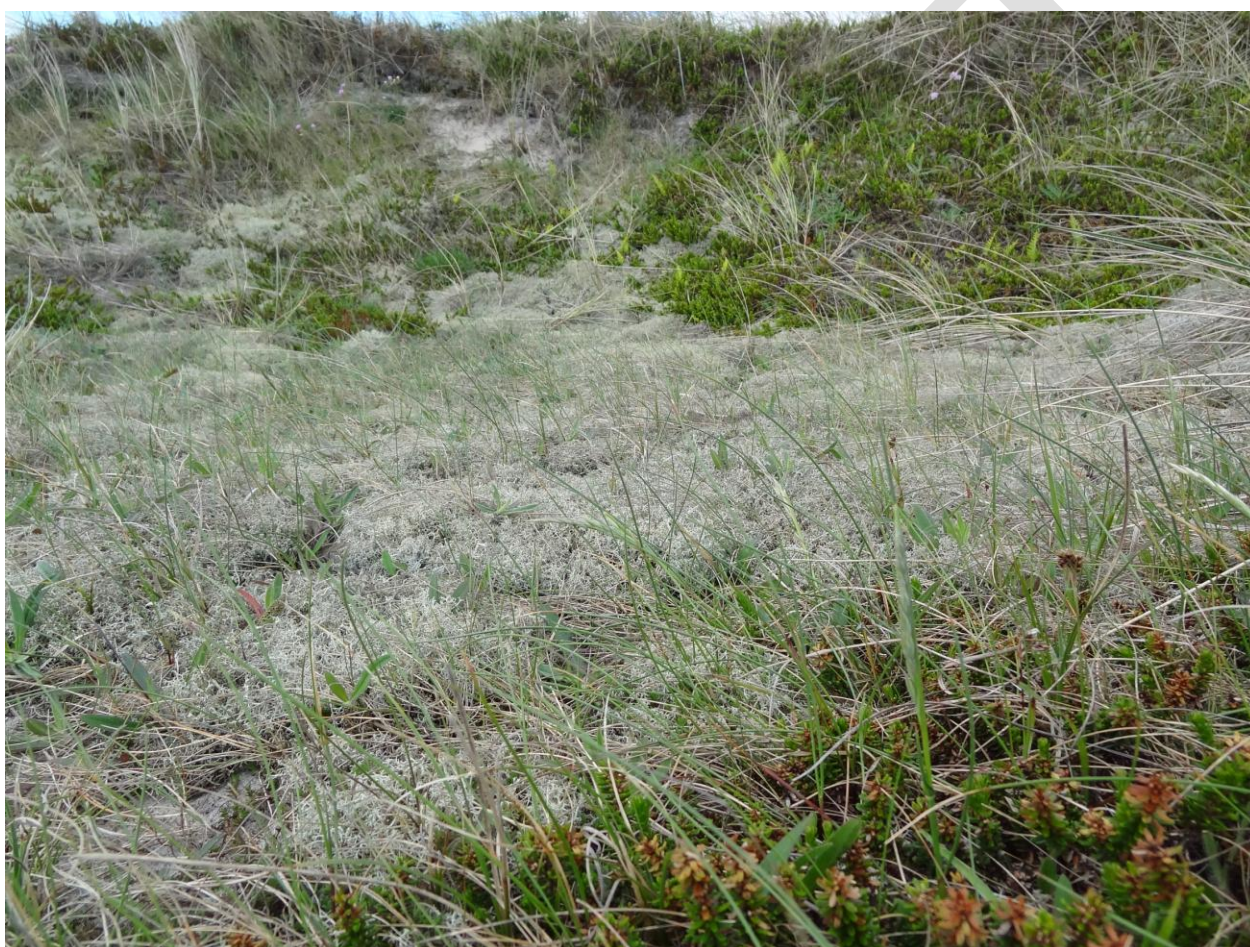
Grå/grøn klit, som er en prioriteret naturtype. Billedet er taget syd for Lyngby.