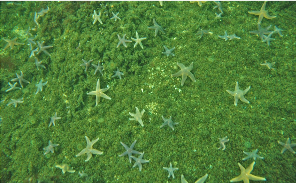
Stenrev med søstjerner.

Området indeholder ud over stenrev fem små sandbanker, som ligger på række gennem området, langs Langelands kyst, og varierer i vanddybder på mellem 13 meter og 22 meter.