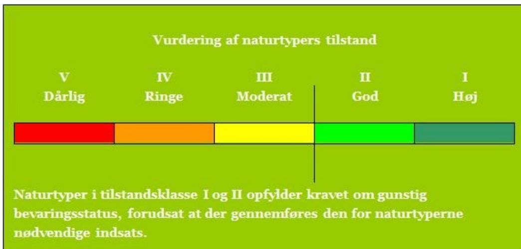
Tilstandsklasser for naturtyper

Til brug for Natura 2000-planlægningen er der for en række naturtyper og nogle arter udviklet et naturtilstandssystem, der på baggrund af artsammensætning og umiddelbart synlige, forvaltningsbare strukturparametre som f.eks. tilgroning, udtørring og forstyrrelser angiver den aktuelle tilstand for naturtypen eller artens levested, jf. Miljøministeriets bekendtgørelse nr. 815 af 27. juni 2007 med senere revisioner om klassificering og fastsættelse af mål for naturtilstanden i internationale naturbeskyttelsesområder. Tilstanden opgøres på en skala fra I-V, hvor naturtyper eller levesteder i tilstandsklasse I og II med en vedvarende nødvendig drift har gunstig bevaringsstatus, mens der for naturtyper eller arters levesteder i tilstandsklasse III-V typisk skal gennemføres en større indledende forvaltningsindsats, før en vedvarende drift vil være tilstrækkeligt til at sikre arealet på sigt.