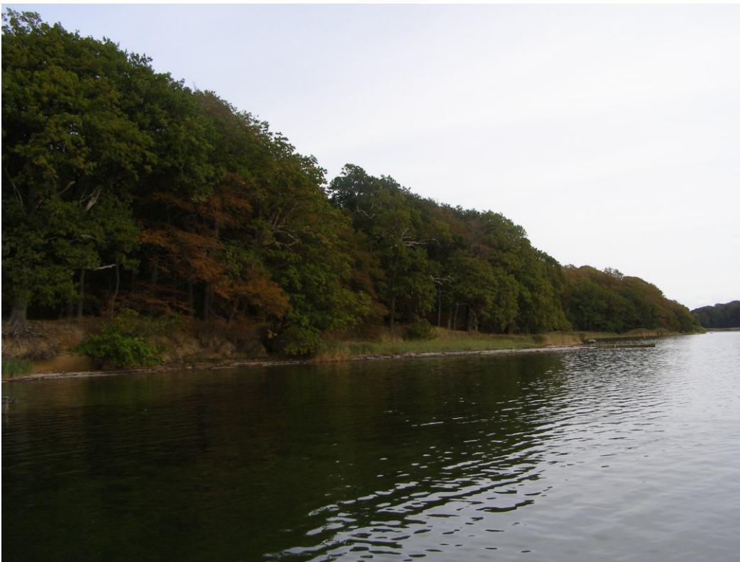
Natura 2000-området ligger kystnært.

Dette Natura 2000-område er udpeget på grundlag af følgende naturtyper: Elle- og askeskov (91E0), Bøg på muld (9130), Ege-blandskov (9160) og næringsrig sø (3150). Natura 2000-planens målsætninger og indsatsprogram er væsentlige elementer i beskyttelsen af disse og af en generel sikring og forbedring af området naturværdier.