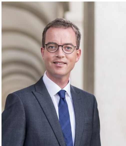
Miljø- og Fødevareminister Esben Lunde Larsen