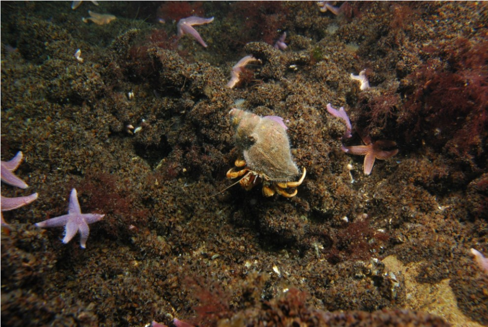
Eremitkrebs og søstjerner er blandt stenrevets beboere.