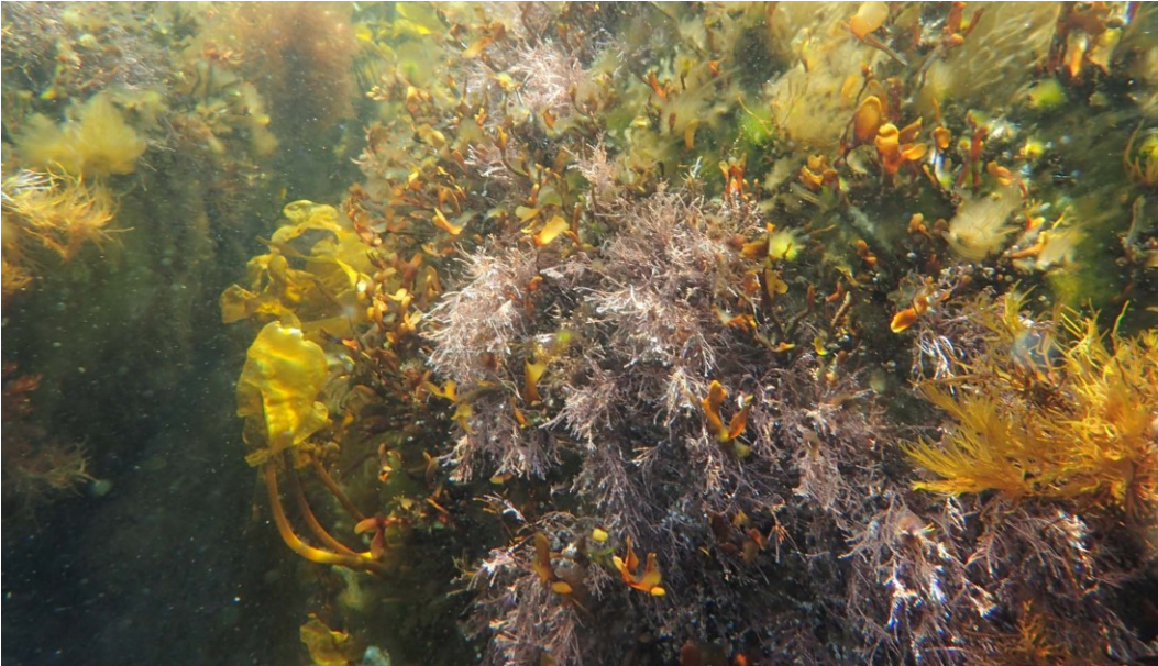
Naturtypen stenrev der findes i området.