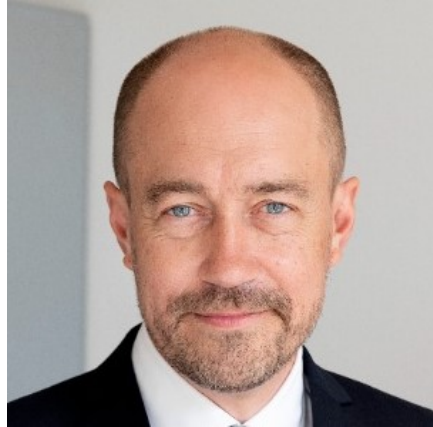
Miljøminister Magnus Heunicke

Natura 2000-områder rummer nogle af Europas og Danmarks største og mest værdifulde naturområder og repræsenterer en stor del af biodiversiteten. De danske Natura 2000-områder bidrager til det fælles EU-mål om 30 pct. beskyttet natur på land og til havs.