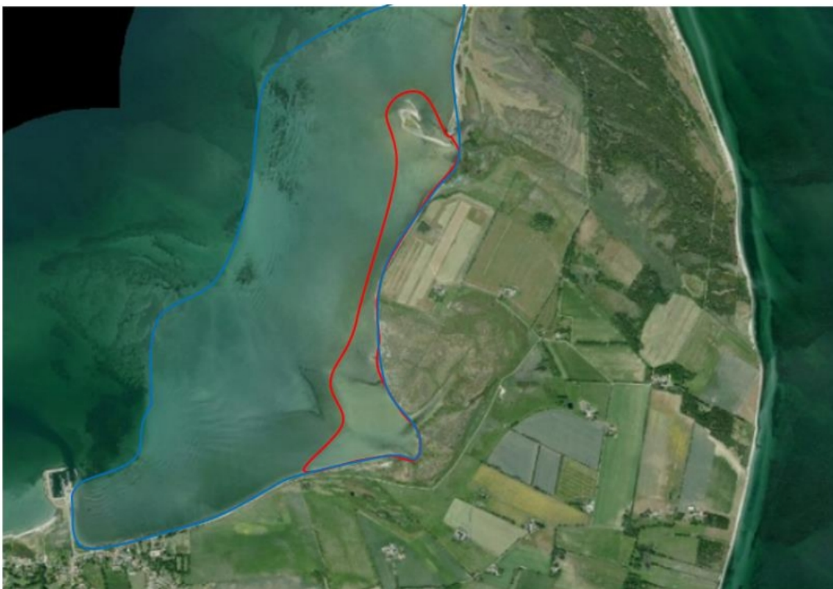
Kort over vadeflader (1140) på Endelave ved Flasken og Terneøen

Den manglende arealmæssige registrering og kortlægning på Miljøgis kortet af naturtypen Vade- flade (1140) har resulteret i, at Kystdirektoratet for nyligt har meddelt en 10 årig tilladelse til klap- ning af havneslam på vadefladen syd for havnen. De store mængder havneslam, der senest er klap- pet i foråret 2022, flyder ud og bevæge sig ind over vadefladen og tilslammer stadig større arealer af den vestlige del af vadefladen og påvirker/ændrer dennes hydraulik og dynamik og har mulige effekter på vadefladens flora og fauna uden en væsentlighedsvurdering har fundet sted.