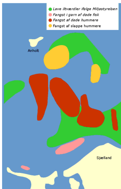
Udbredelsen af iltsvind i Kattegat 1986

Med Danmarks Naturfredningsforening i spidsen rejste der sig en voldsom debat med krav om, at der nu blev der grebet ind overfor forureningen fra landbrug, kommuner og industrien. Dette betød, at Folketinget i 1987 vedtog den første vandmiljøplan med ensartede krav til udledning af spildevand fra rensesanlæg. Anlæg større end 15.000 personækvivalenter skulle rense for både organisk stof, kvælstof og fosfor. Anlæg større end 5.000 personækvivalenter skulle rense for organisk stof og fosfor. Udløbskravene blev fastsat ud fra de resultater, der var opnået med Silkeborgs rensesanlæg, Søholt, der som før nævnt, var det første større anlæg i Danmark bygget til at fjerne organisk stof, kvælstof og fosfor. Vandkvalitetsinstituttet (VKI) gennemførte sidst i 70'erne en større undersøgelse af Søholt-anlægget for Kommunernes Landsforening, og derfor forelå der veldokumenterede data for hvilken rensning, der kunne opnås på det mest moderne rensesanlæg i Danmark.