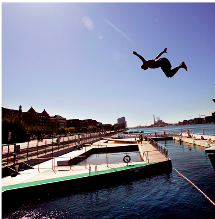
Badende i Københavns havn i nutiden