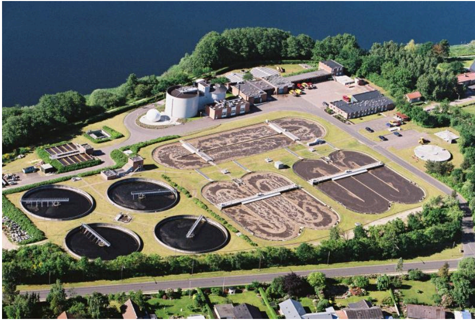
Silkeborgs renselanlæg, Søholt, var et epokegørende anlæg i Danmark – det første større anlæg, der kunne fjerne fosfor og kvælstof. Indviet i 1976.