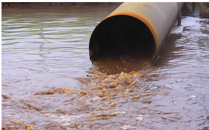
Som det ofte så ud i 1971

Siden starten af Ministeriet for Forureningsbekæmpelse i 1971 og oprettelsen af Miljøstyrelsen i 1972 er Danmark blevet et meget rent land i forhold til spildevandsudledning. De to billeder beskriver godt den udvikling, vi har været vidne til siden dengang.