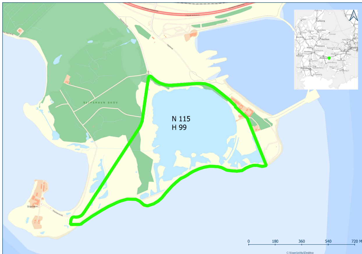
1: Afgræsning af Natura-2000 område nr. 115 og habitatområde 99 (grøn afgrænsning)