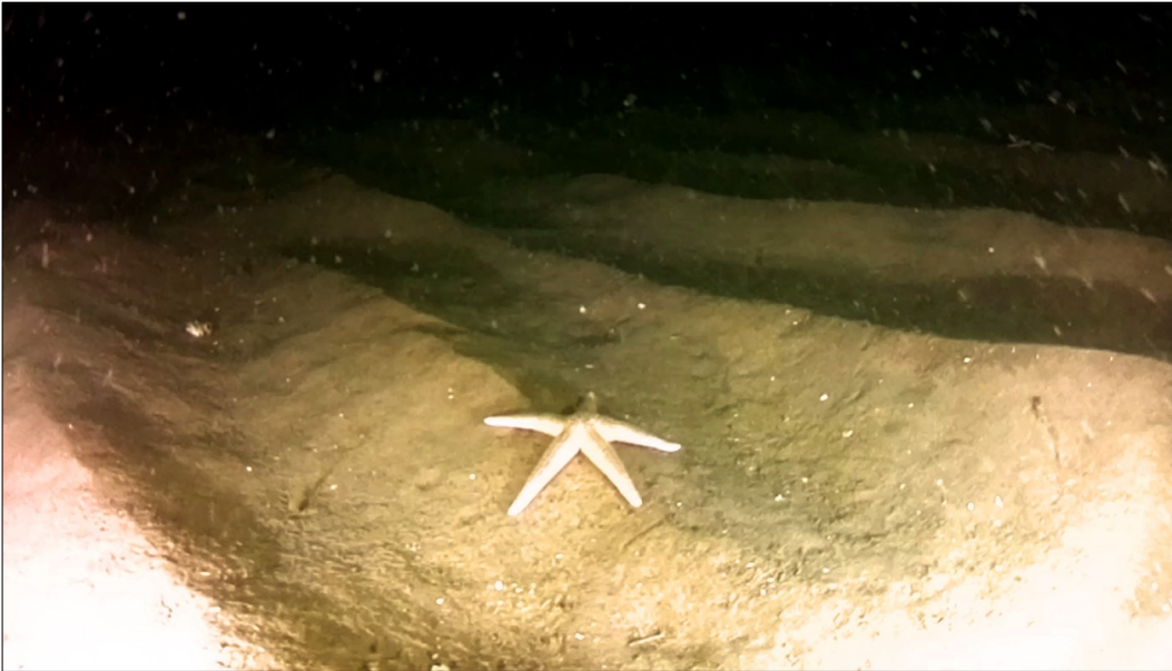
Naturtypen sandbanke med Ludia søstjerne.