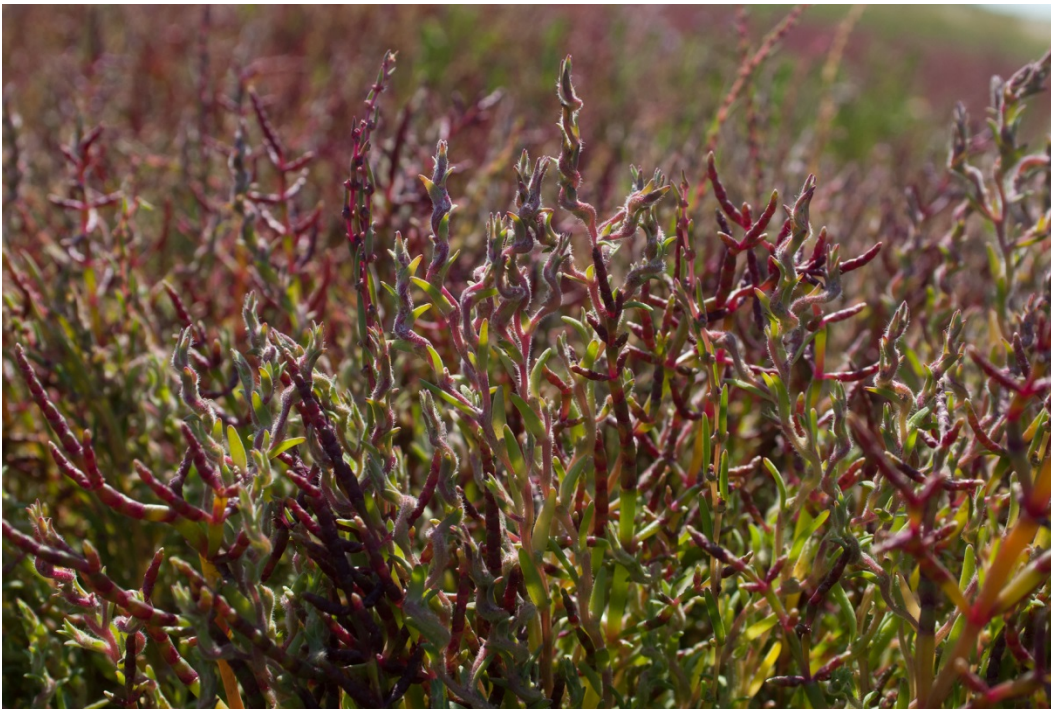
I de mere salte dele af strandengen på Thurø Rev findes der pæne bestande af både kveller og tangurt.

Der er ikke konstateret modsatrettede interesser i området.