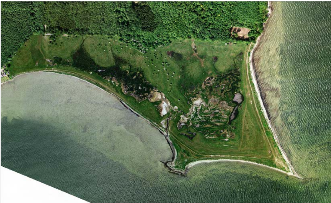
Thurø Rev er opbygget af strandvolde, som omkranser en våd strandeng med veludviklet losystem.

Natura 2000-planens målsætninger og indsatsprogram er væsentlige elementer i beskyttelsen af disse og af en generel sikring og forbedring af områdets naturværdier.