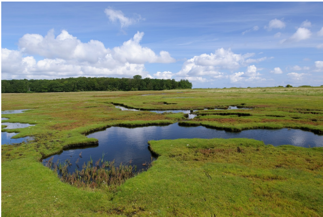
Strandengen på Thurø Rev har et veludviklet system af tidevandsrender – et losystem. Strandengen er fint afgræsset, og på de højere liggende arealer findes tuer af gul engmyre.

Det er en fælles opgave for kommuner og offentlige lodsejere at aftale nærmere på hvilke arealer og i hvilke kommuner, den konkrete indsats skal foregå.